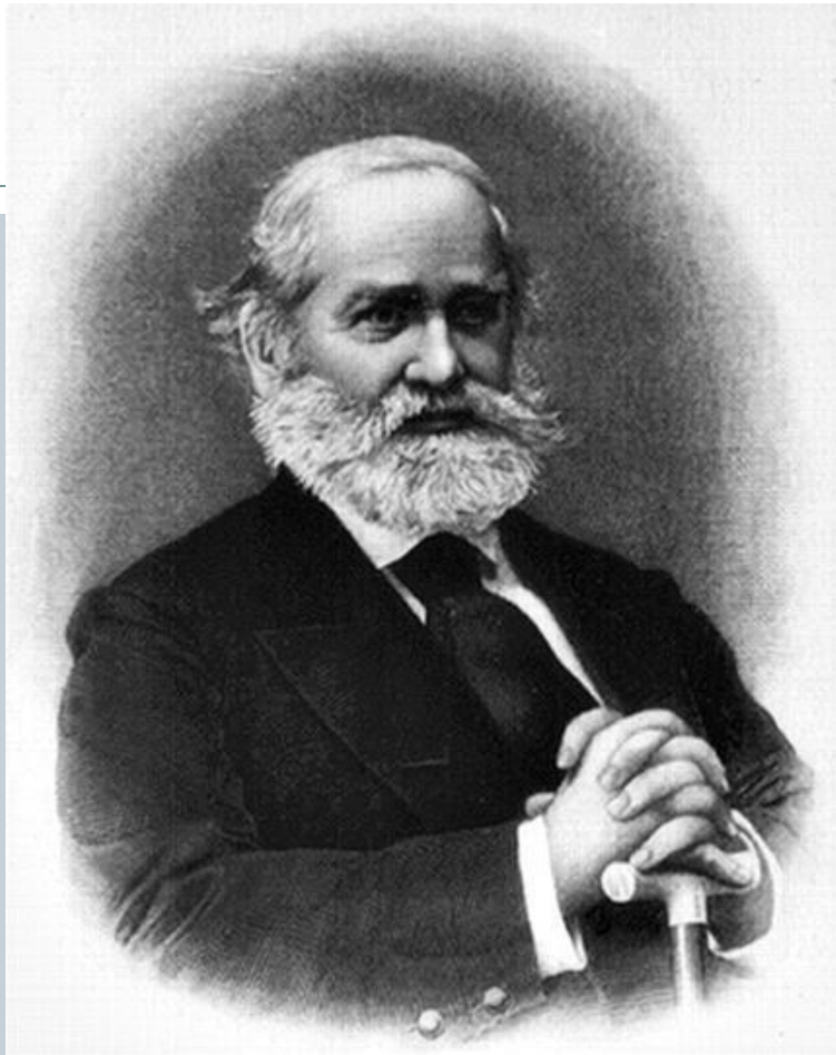
С.М. Соловьев (1820-1879 гг.)

«Если к каждому частному человеку можно обратиться с вопросом: «Скажи нам, с кем ты знаком, и мы скажем тебе, кто ты таков», – то к целому народу можно обратиться со следующими словами: «Расскажи нам свою историю, и мы скажем тебе, кто ты таков». В настоящее время, когда у нас обнаружилась такая сильная потребность познать свое прошлое, познать, кто мы таковы, я не решился занять ваше внимание изложением событий внешней отечественной истории, но счел более приличным представить в сжатом очерке важнейшую сторону нашей внутренней истории, именно постепенное установление государственного порядка, или, как выражались наши предки, наряда в Русской земле. Где, при каких природных влияниях действовал народ и с какими чужими народами и государствами изначала и преимущественно должен был иметь дело – вот первые вопросы в истории каждого народа».