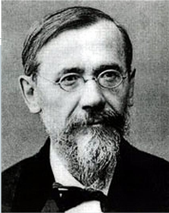
В.О. Ключевский (1841-1811 гг.)

«...народ становится государством, когда чувство национального единства получает выражение в связях политических, в единстве верховной власти и закона. В государстве народ становится не только политической, но и исторической личностью с более или менее ясно выраженным национальным характером и сознанием своего мирового значения... складываясь из союзов кровного родства, общественный состав государства подвергался обратному процессу внутреннего расчленения по разнообразным частным интересам, материальным и духовным. Так возникали многообразные частные союзы, которые входят в состав гражданского общества». В.О. Ключевский. Русская история. Полный курс лекций в трех книгах. Лекция I.