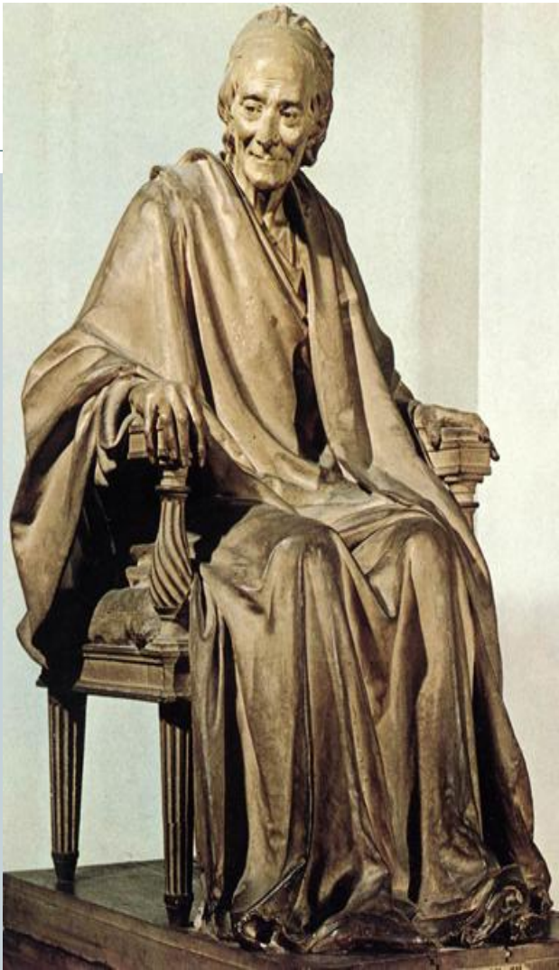
Вольтер (Франсуа Мари Аруэ, 1694-1778 гг.)

«Большинство великих мира сего живут так, как если бы они были атеистами: всякий, кто прожил жизнь и был наблюдателен, знает, что познание Бога, его присутствие и правосудие не имеют ни малейшего влияния на войны, союзы, а также на объекты тщеславия, выгоды, удовольствий, похищающих каждое мгновение жизни этих людей; однако нет того, чтобы они грубо попирали правила, установленные в обществе, и потому гораздо более приятно проводить свою жизнь рядом с ними, нежели с суеверными людьми и фанатиками. Правда, я ожидаю большей справедливости от того, кто верит в Бога, чем от того, кто в него не верит; но от суеверных людей я жду только горечи и преследований. Атеизм и фанатизм – два чудовища, способные разодрать на части и пожрать общество...».