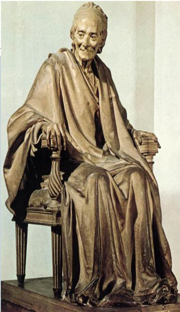
Вольтер (Франсуа Мари Аруэ, 1694-1778 гг.)

«Большинство великих мира сего живут так, как если бы они были атеистами: всякий, кто прожил жизнь и был наблюдателен, знает, что познание Бога, его присутствие и правосудие не имеют ни малейшего влияния на войны, союзы, а также на объекты тщеславия, выгоды, удовольствий, похищающих каждое мгновение жизни этих людей; однако нет того, чтобы они грубо попирали правила, установленные в обществе, и потому гораздо более приятно проводить свою жизнь рядом с ними, нежели с суеверными людьми и фанатиками. Правда, я ожидаю большей справедливости от того, кто верит в Бога, чем от того, кто в него не верит; но от суеверных людей я жду только горечи и преследований. Атеизм и фанатизм – два чудовища, способные разодрать на части и пожрать общество...».