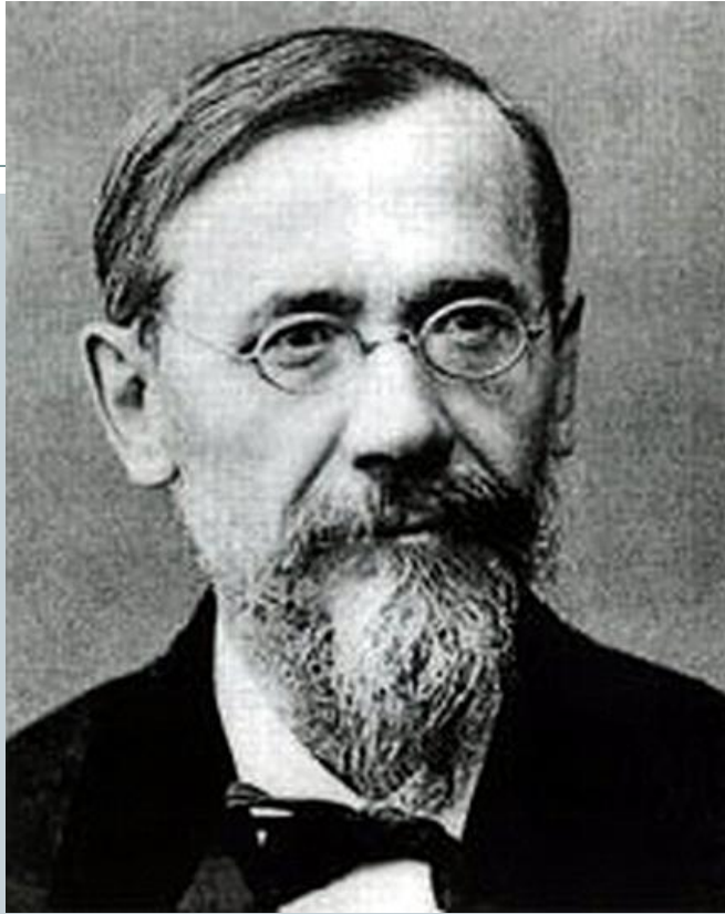
В.О. Ключевский (1841-1811 гг.)

«...народ становится государством, когда чувство национального единства получает выражение в связях политических, в единстве верховной власти и закона. В государстве народ становится не только политической, но и исторической личностью с более или менее ясно выраженным национальным характером и сознанием своего мирового значения... складываясь из союзов кровного родства, общественный состав государства подвергался обратному процессу внутреннего расчленения по разнообразным частным интересам, материальным и духовным. Так возникали многообразные частные союзы, которые входят в состав гражданского общества». В.О. Ключевский. Русская история. Полный курс лекций в трех книгах. Лекция I.