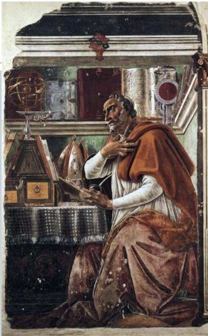
Святой Августин (Августин Аврелий, епископ Гиппонский, (354-430 гг.))

«Итак, при отсутствии справедливости, что такое государства, как не большие разбойничьи шайки; так как и сами разбойничьи шайки есть не что иное, как государства в миниатюре».