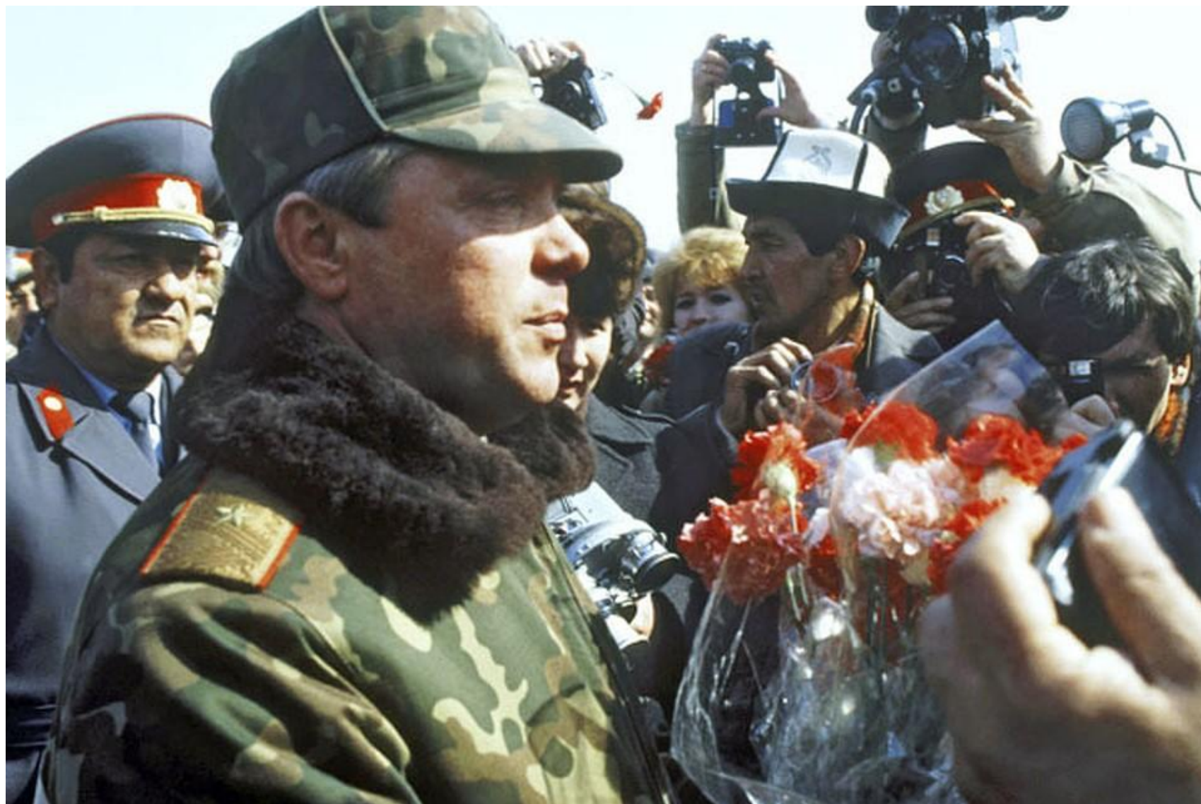
Генерал-полковник Борис Громов: "Мы ушли из..."