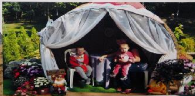
Мелка Калужка "Среди цветов"