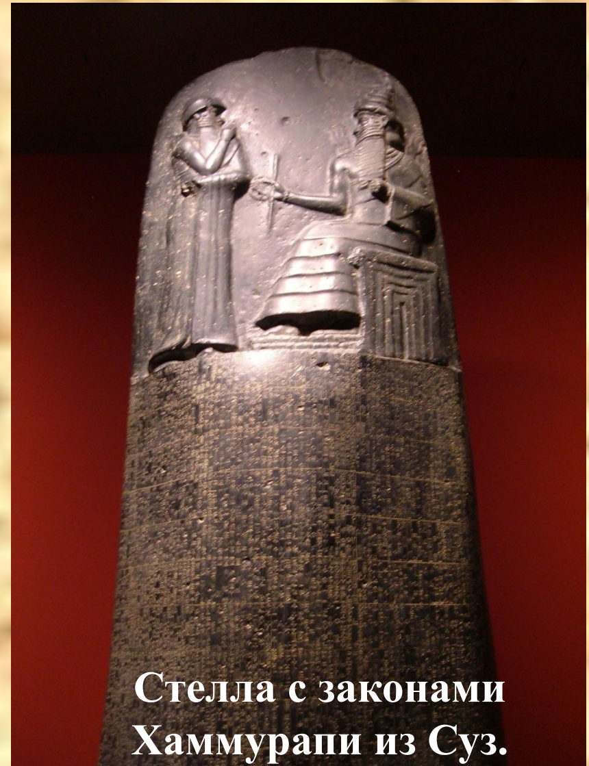
Стелла с законами Хаммурапи из Суз.