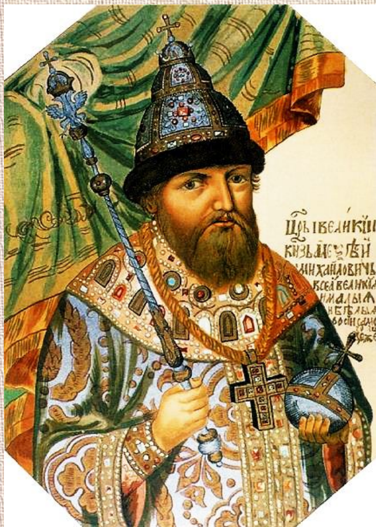
Алексей Михайлович Романов