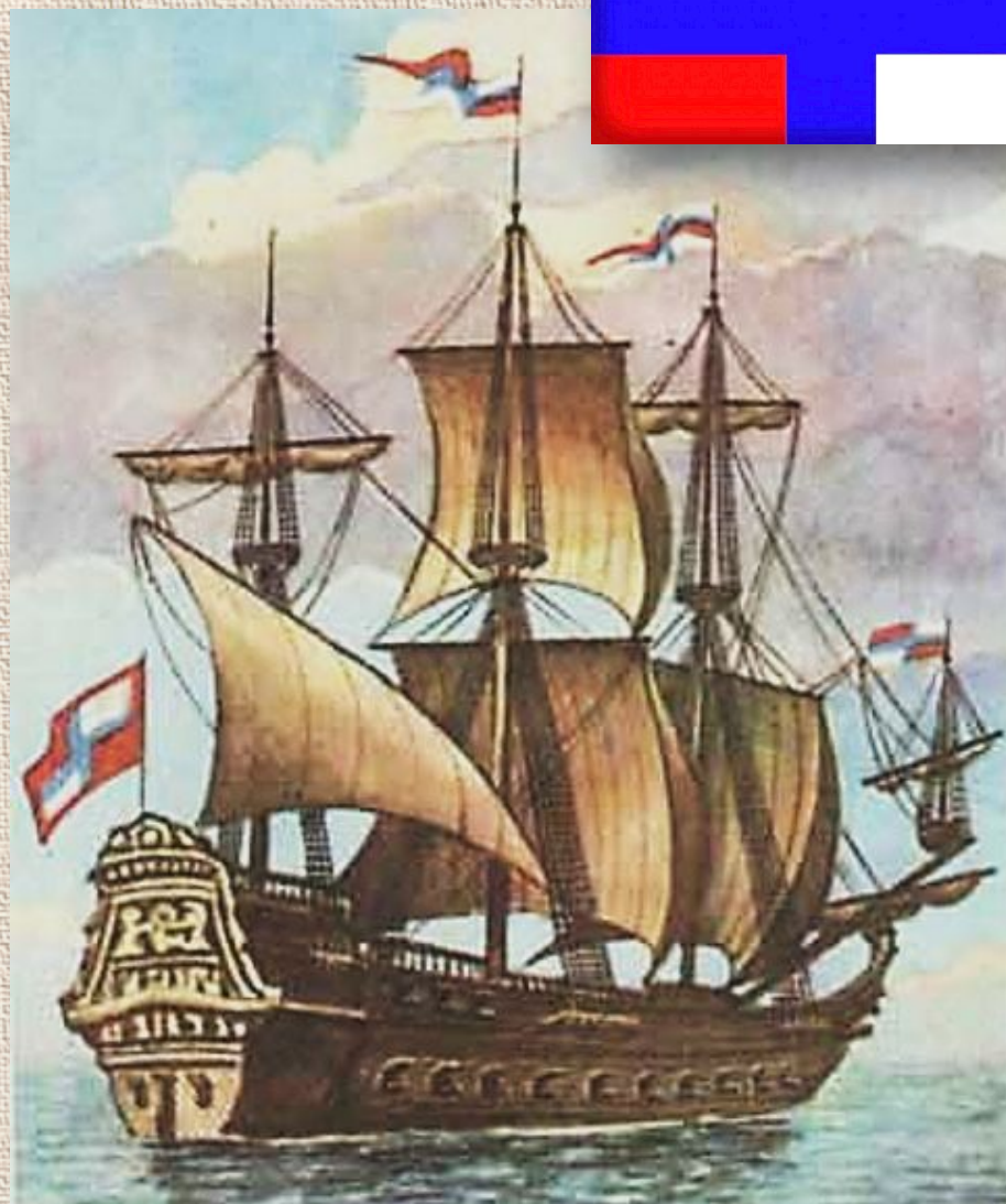
Русский боевой корабль «Орел»