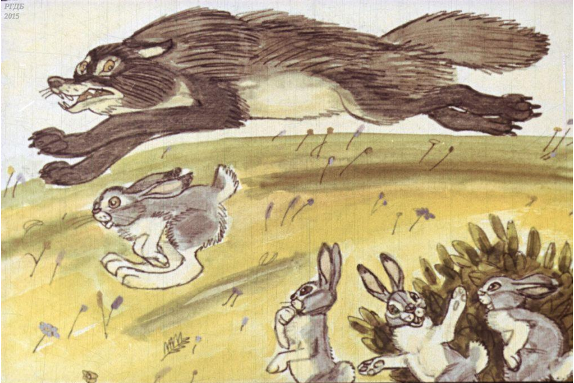
Выглянули зайчата из-за куста. И правда, Волк и Зайчишка рядом бегут.