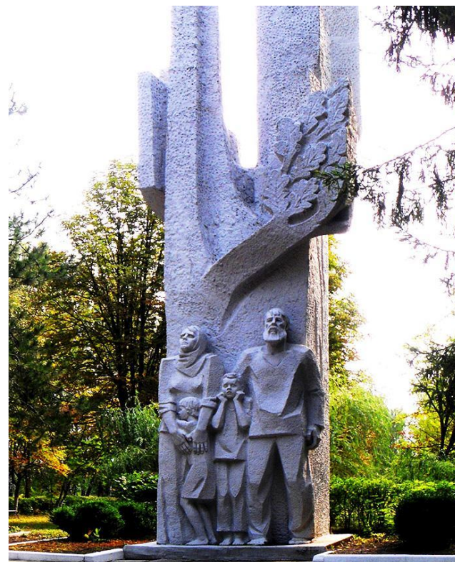
Памятник «Последние минуты»