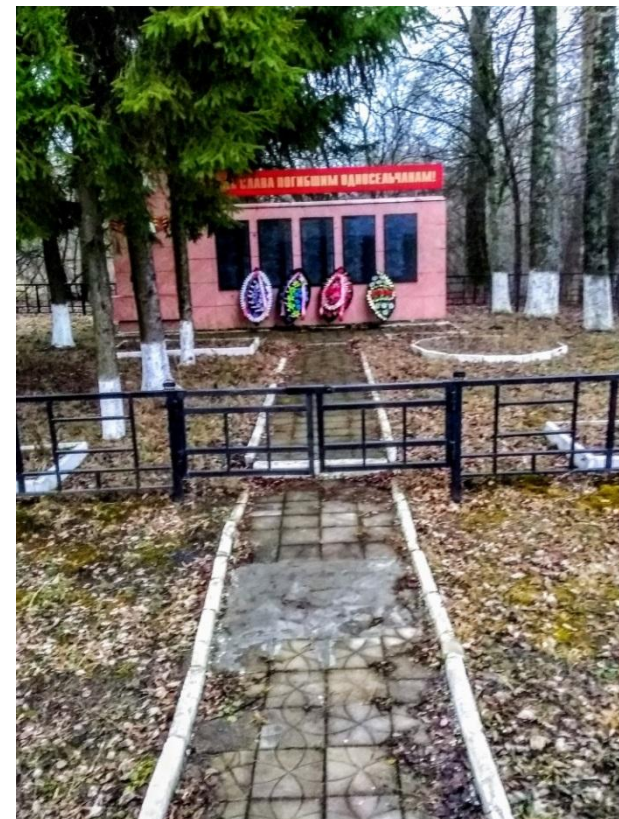
Памятник воинам-участникам Курской битвы