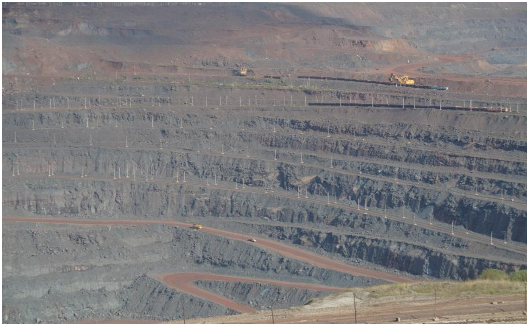
Вид карьера со смотровой площадки