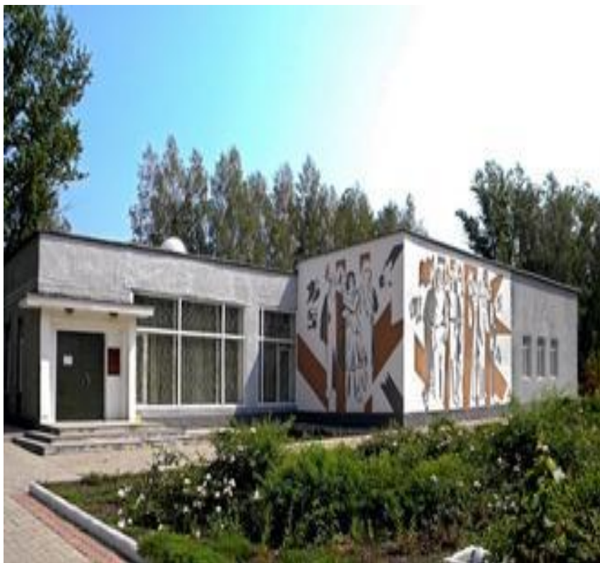
Музей-заповедник «Большой дуб»

музей-заповедник, «Курская Хатынь». Во время Великой Отечественной войны, 17 октября 1942 жители посёлка (44 человека — женщины, дети и старики) были расстреляны, а затем их трупы и все дома поселка были сожжены.