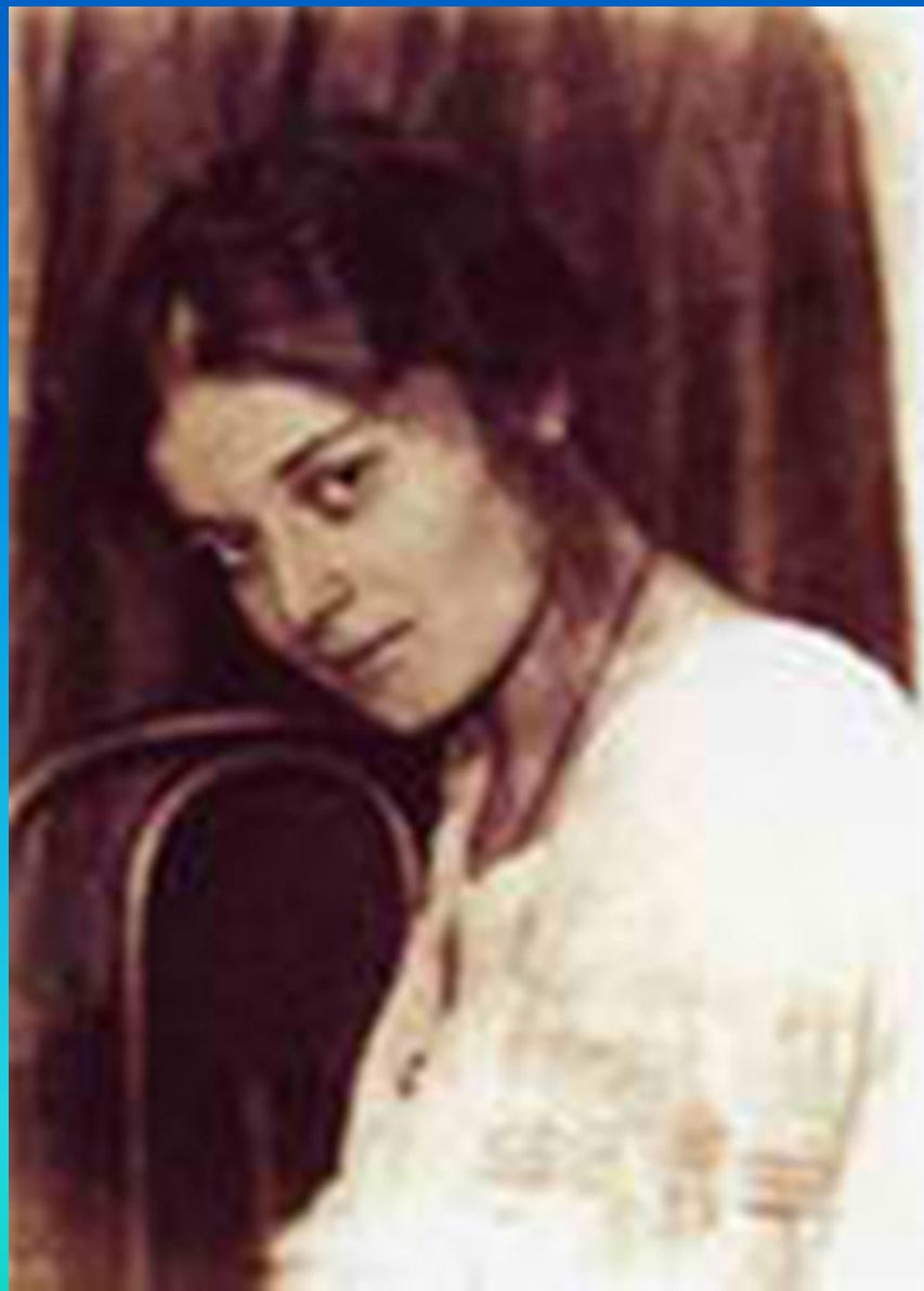
Августа Леонидовна Миклашевская