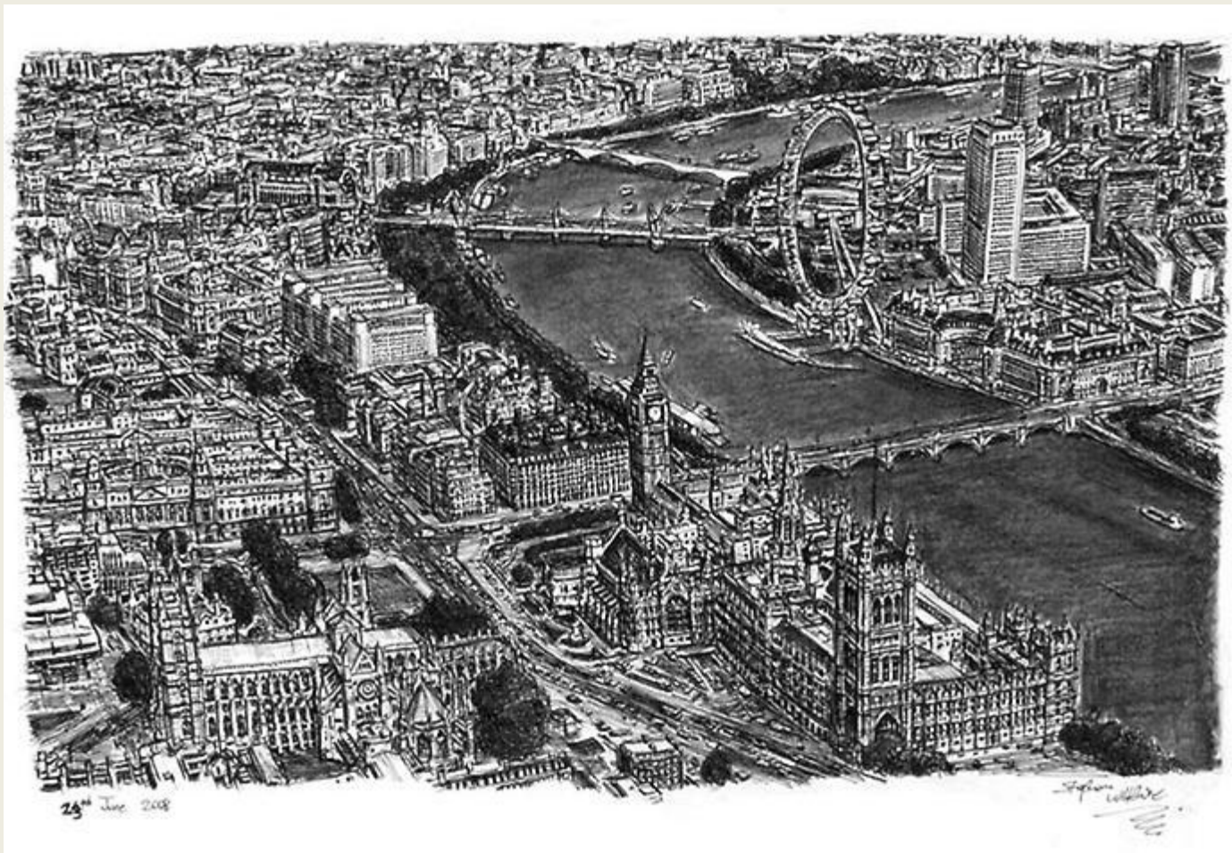
Стивен Уилтшер. Панорама Лондона.