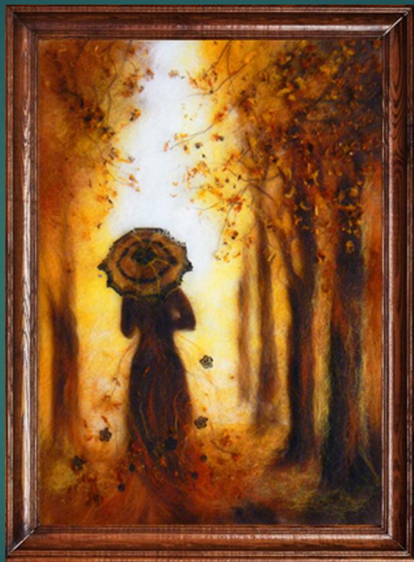
4. Оформление картины в раму