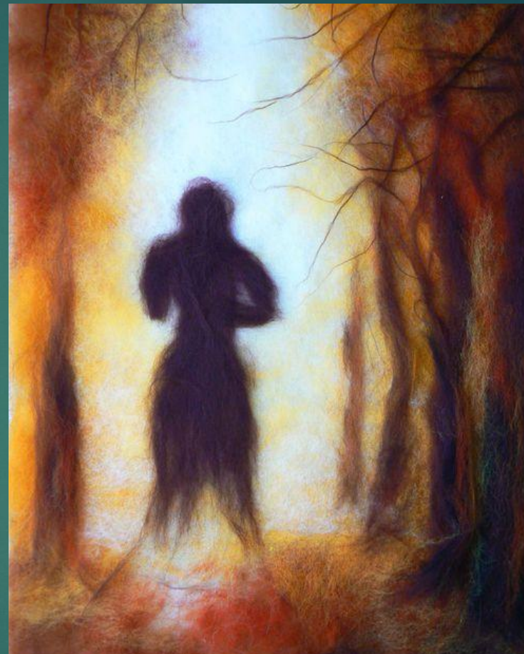
3. Работа над передним планом картины (изображения предметов четкие, видны мелкие детали)