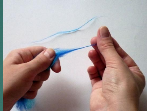
Вытягивание и подкручивание