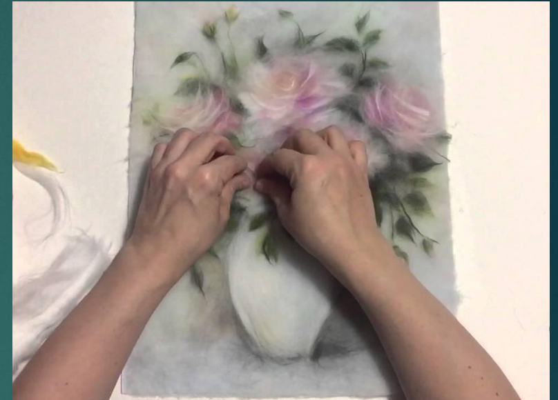
Шерстяная акварель (живопись шерстью)