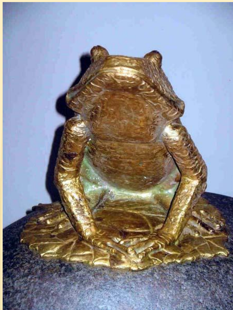
Санкт - Петербург