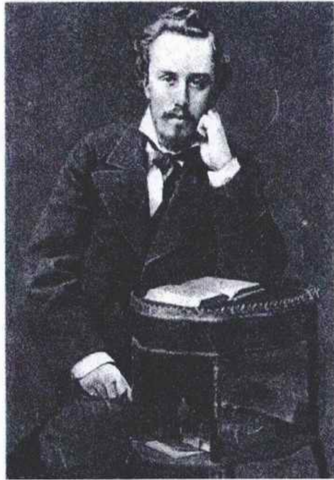
А.Л. БЛОК (отец поэта).