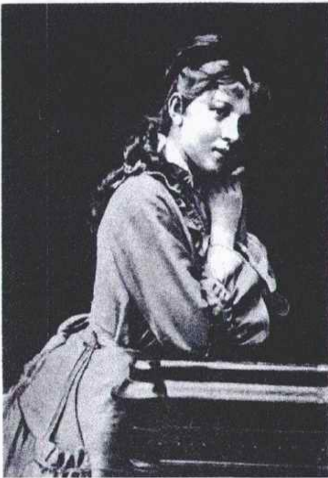
А.А. БЛОК (мать поэта).