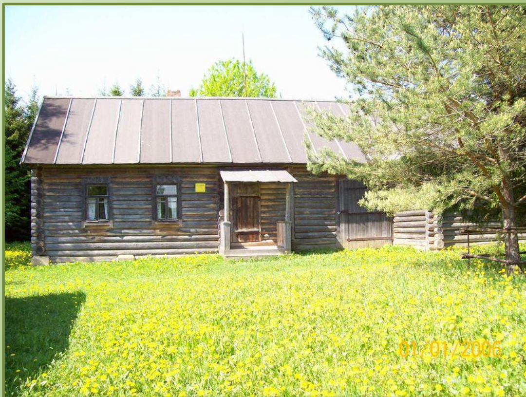
Дом Александра Трифоновича в Смоленской области. (После реставрации)

Родился на Смоленщине. С детства познакомился с русской классикой. В 1922 г. заканчивает четыре класса. С 1924 г. посылает в местные газеты заметки. Поэтический дебют Твардовского состоялся в 1925 г. Молодого поэта поддержал М. В. Исаковский. В 1929 Твардовский уезжает в Москву в поисках постоянной литературной работы, в 1930 — возвращается в Смоленск и живет до 1936. Этот период совпал с тяжелыми испытаниями его семьи: родители и братья были раскулачены и сосланы.