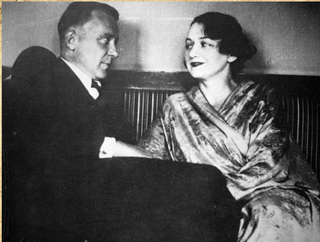
Михаил Афанасьевич Булгаков и Елена Сергеевна Шиловская (1893 — 1970)

Моя последняя любовь С улыбкой горькой на устах Кто же являетесь В несбыточных мечтах