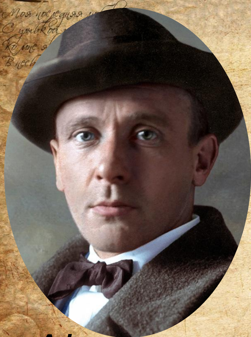
Афанасьевич Булгаков 1891 – 1940