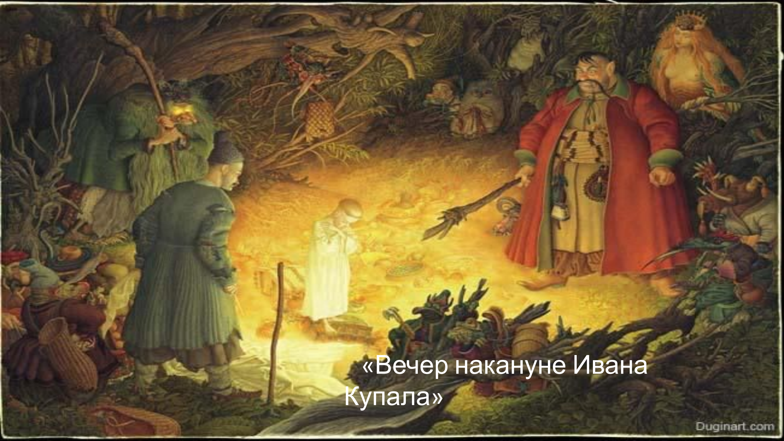
«Вечер накануне Ивана Купала»