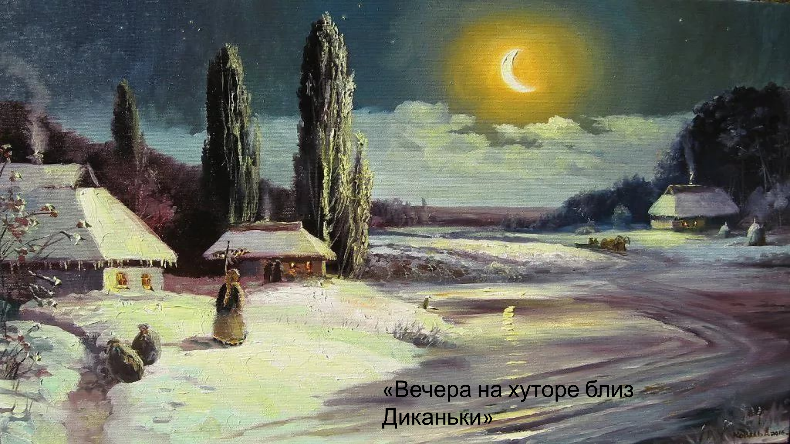
«Вечера на хуторе близ Диканьки»