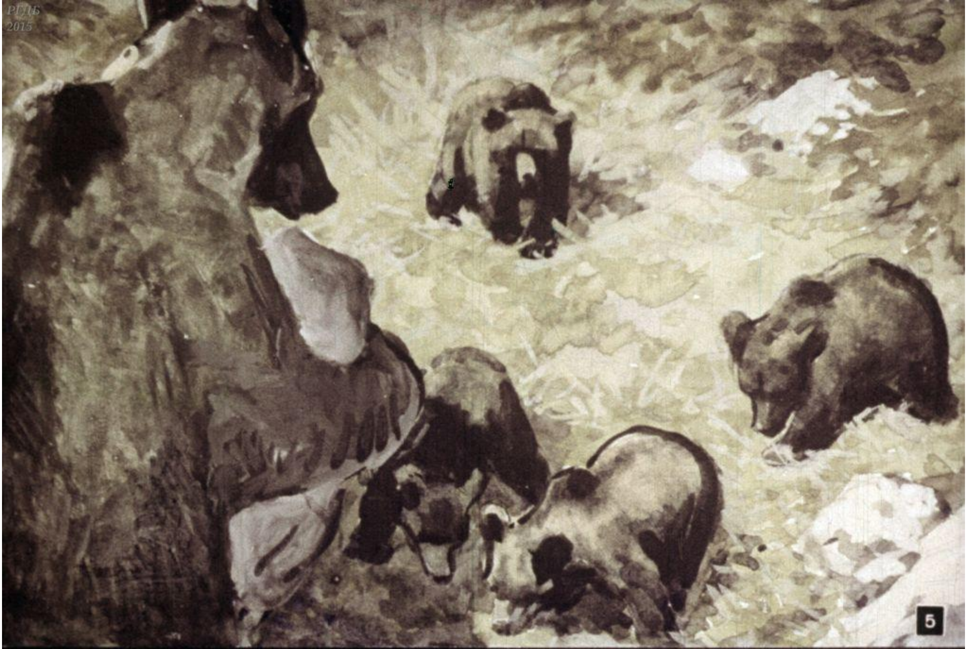
Медвежата бросались, как нуча поросят, и вылизывали прятавшихся там жуков и червей.