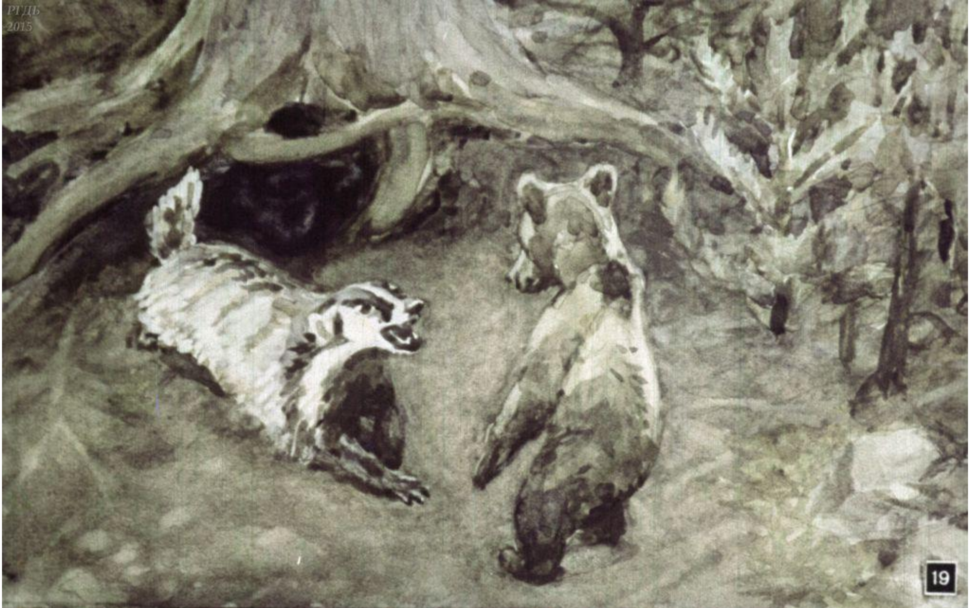
Когда он спустился к реке поискать кореньев, которые показывала ему мать, на него бросился какой-то, по-видимому свирепый зверь. Это был барсук.