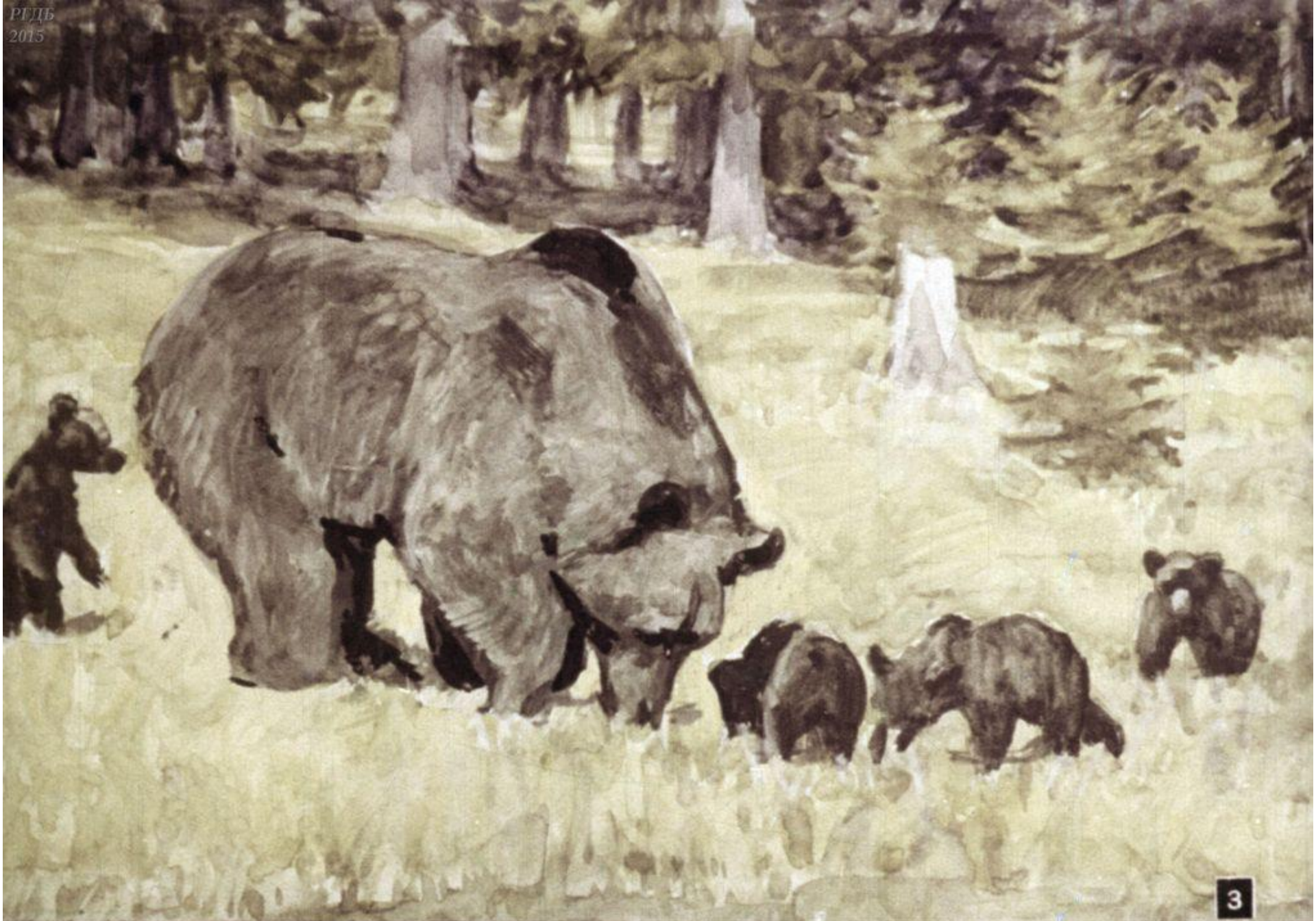
Она показывала малышам, где искать землянику...