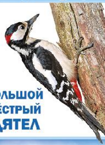
БОЛЬШОЙ ПЁСТРЫЙ ДЯТЕЛ