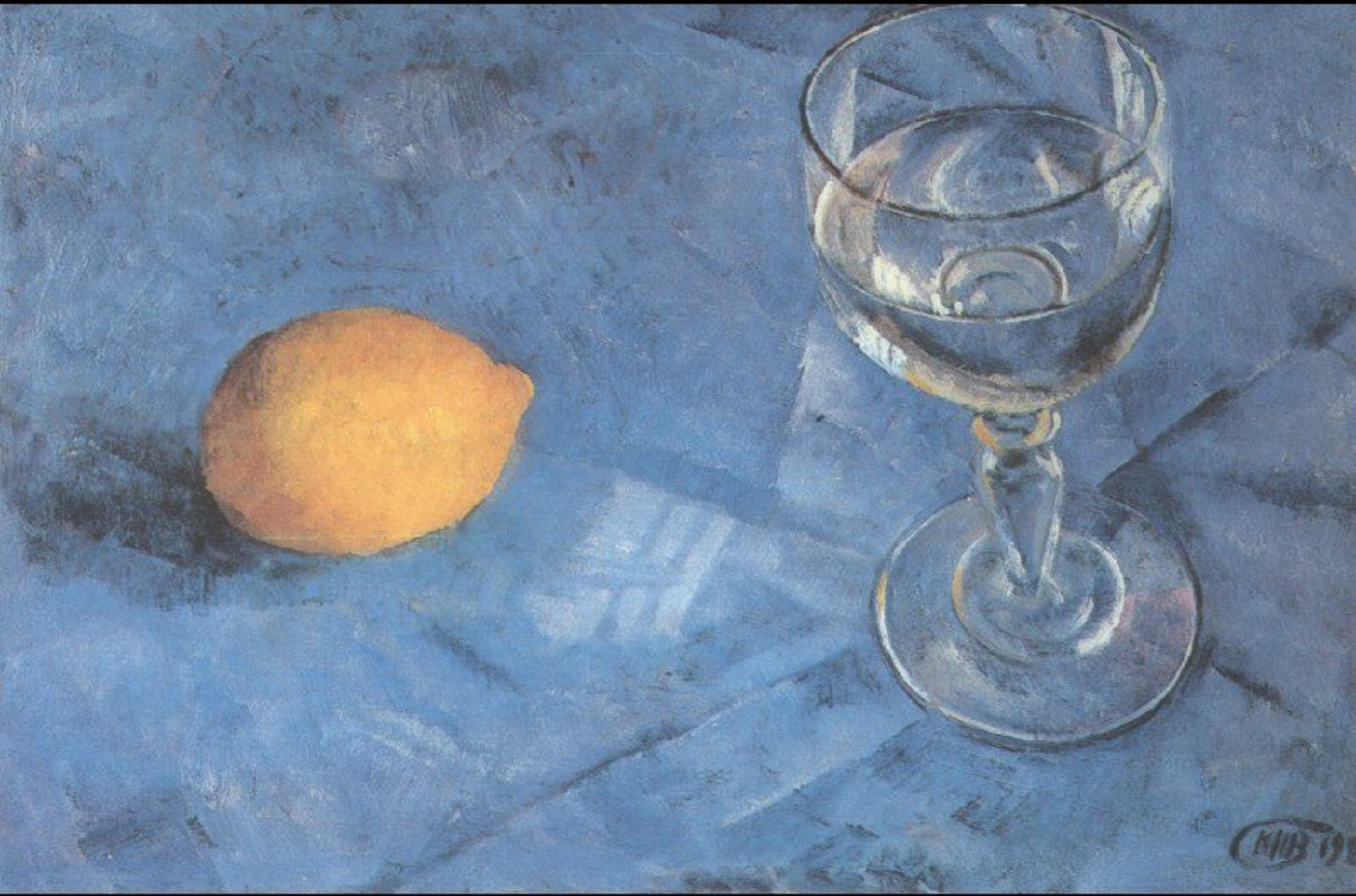
«Бокал и лимон» (К. С. Петров – Водкин)