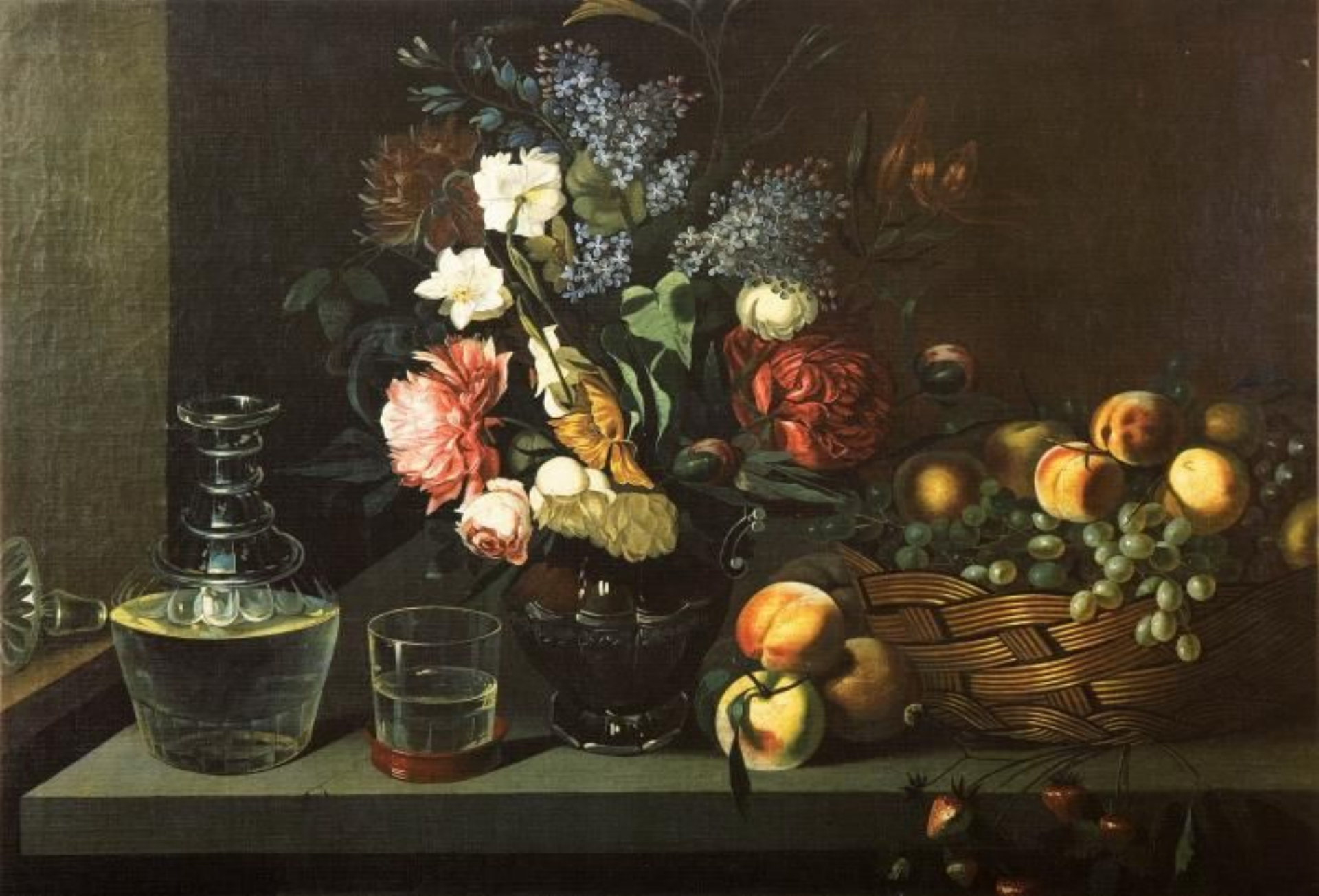
«Натюрморт» (фрагмент) (И. Т. Хруцкий)