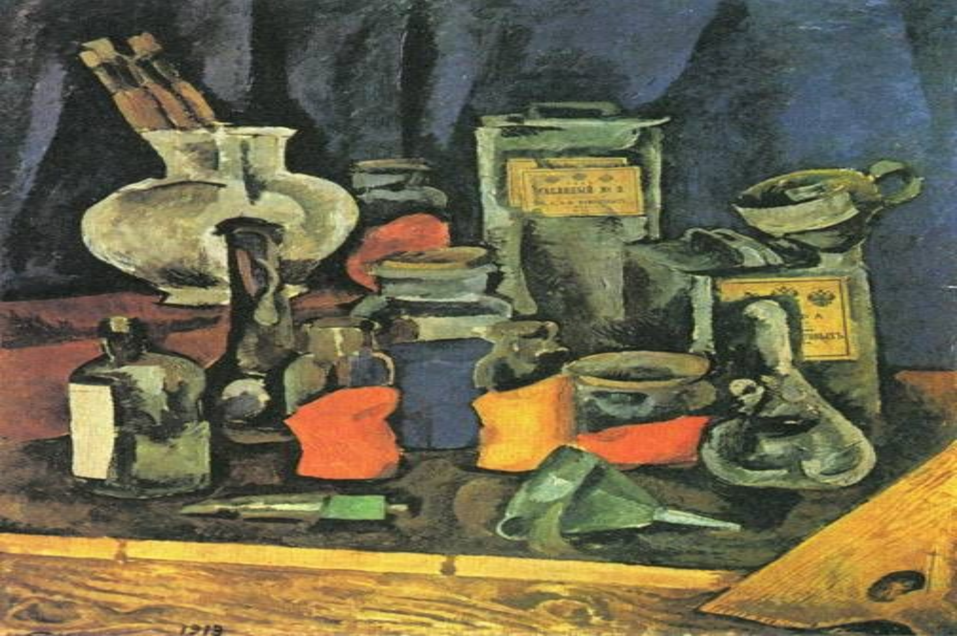
«Сухие краски» (П. П. Кончаловский)