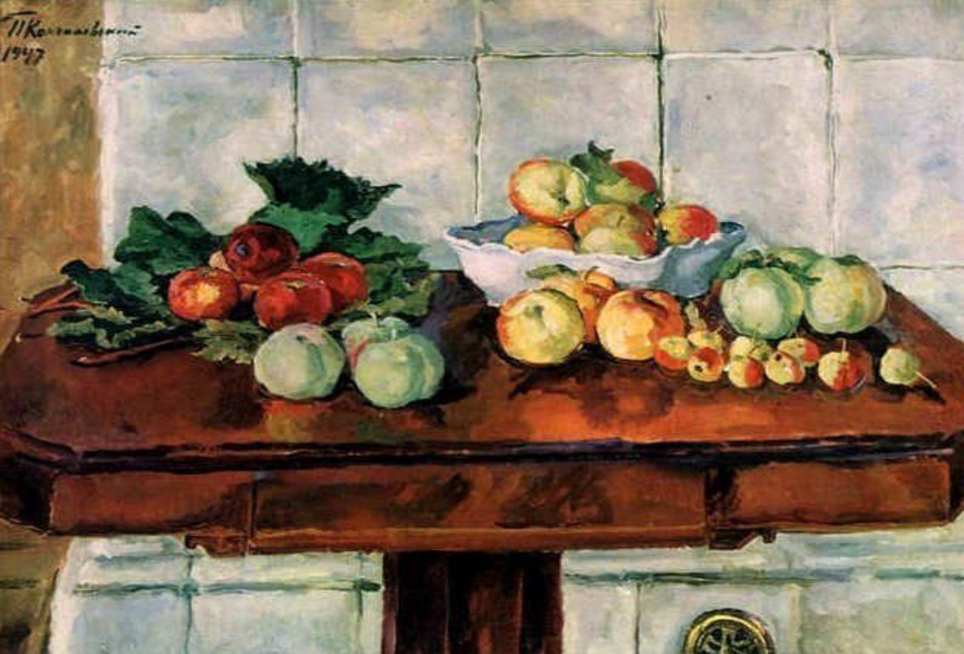
«Яблоки на столе у печки» (П. П. Кончаловский)