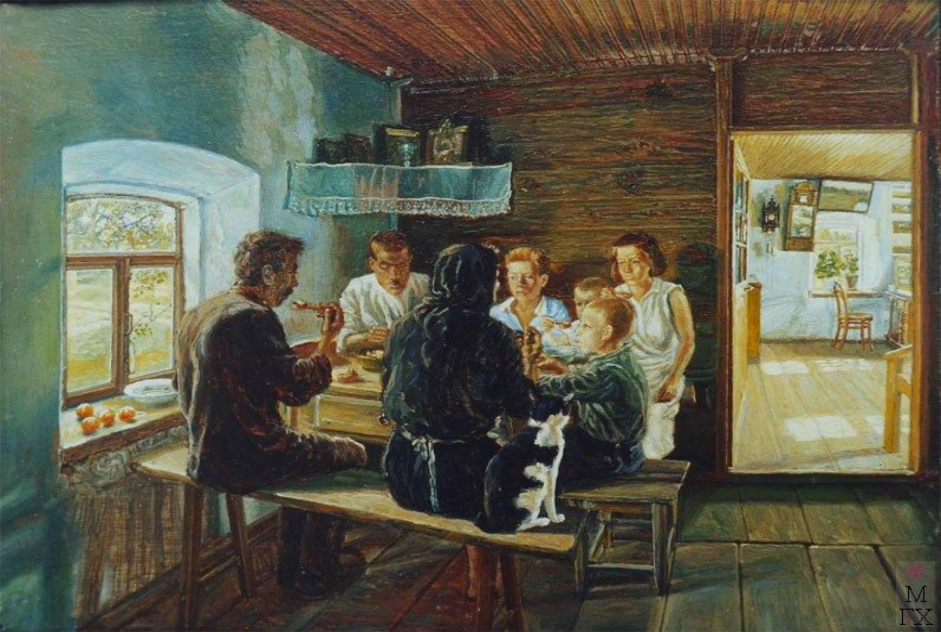
«За обедом» (З. Е. Серебрякова)