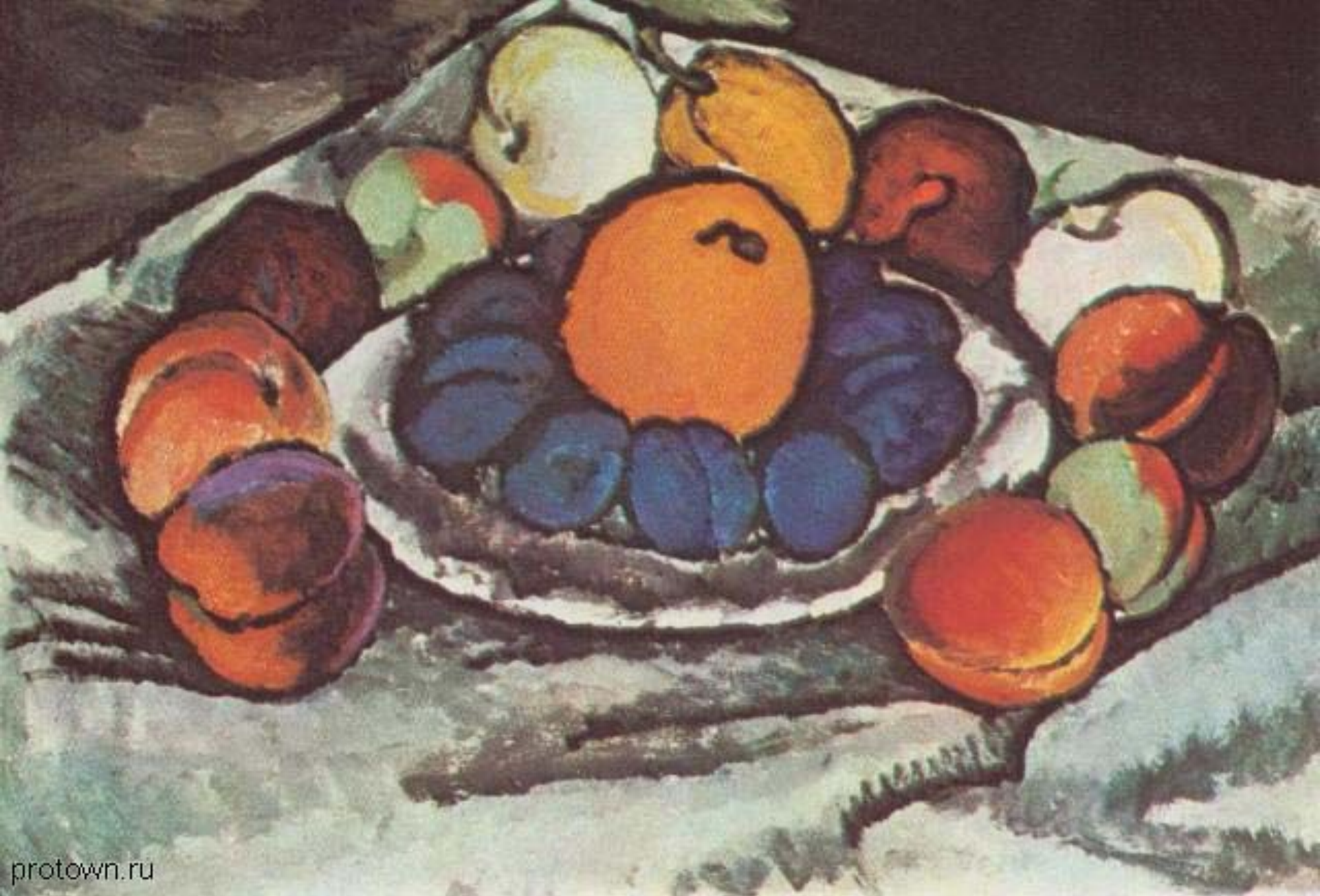
«Натюрморт. Синие сливы» (И. И. Машков)