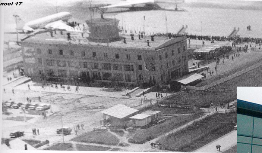
Аэропорт Владивосток в 1966 году.