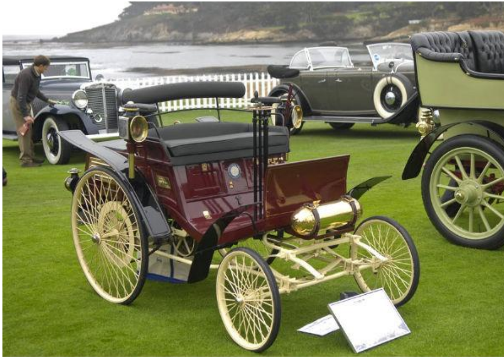
1894 das Auto "Velo" das erste Serienauto