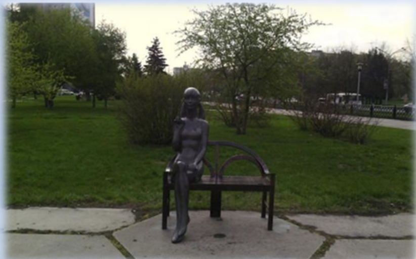
молодая барышня с книгой