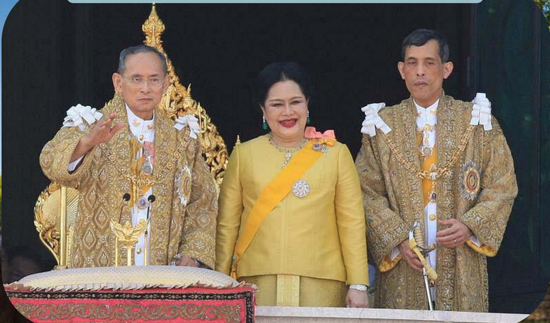
Рама IX, королева Сирикит, Рама X.