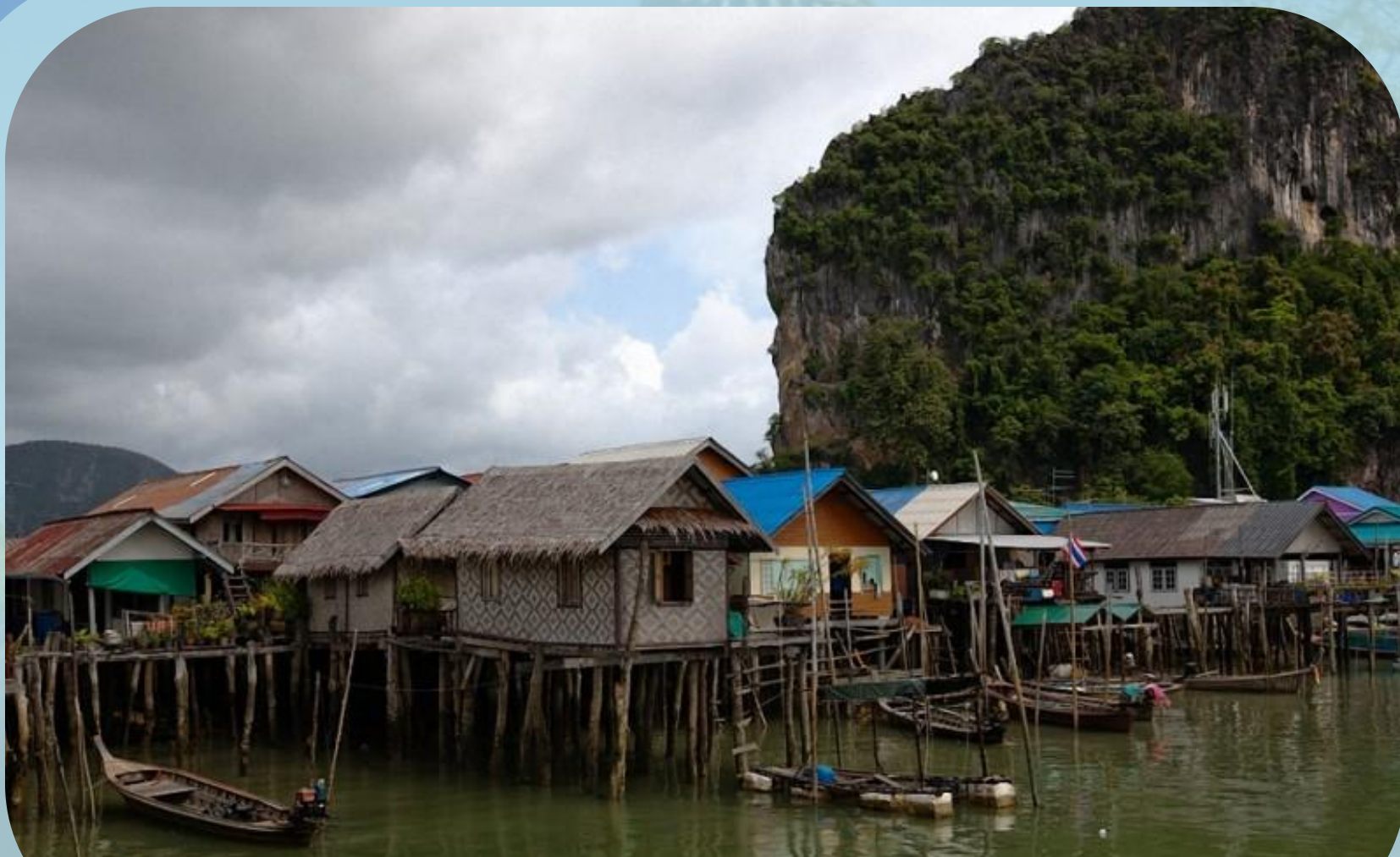
Деревня морских цыган.