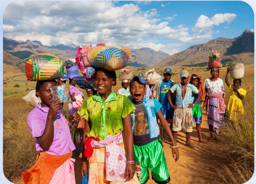
Крестьяне отмечают Фестиваль риса (май)