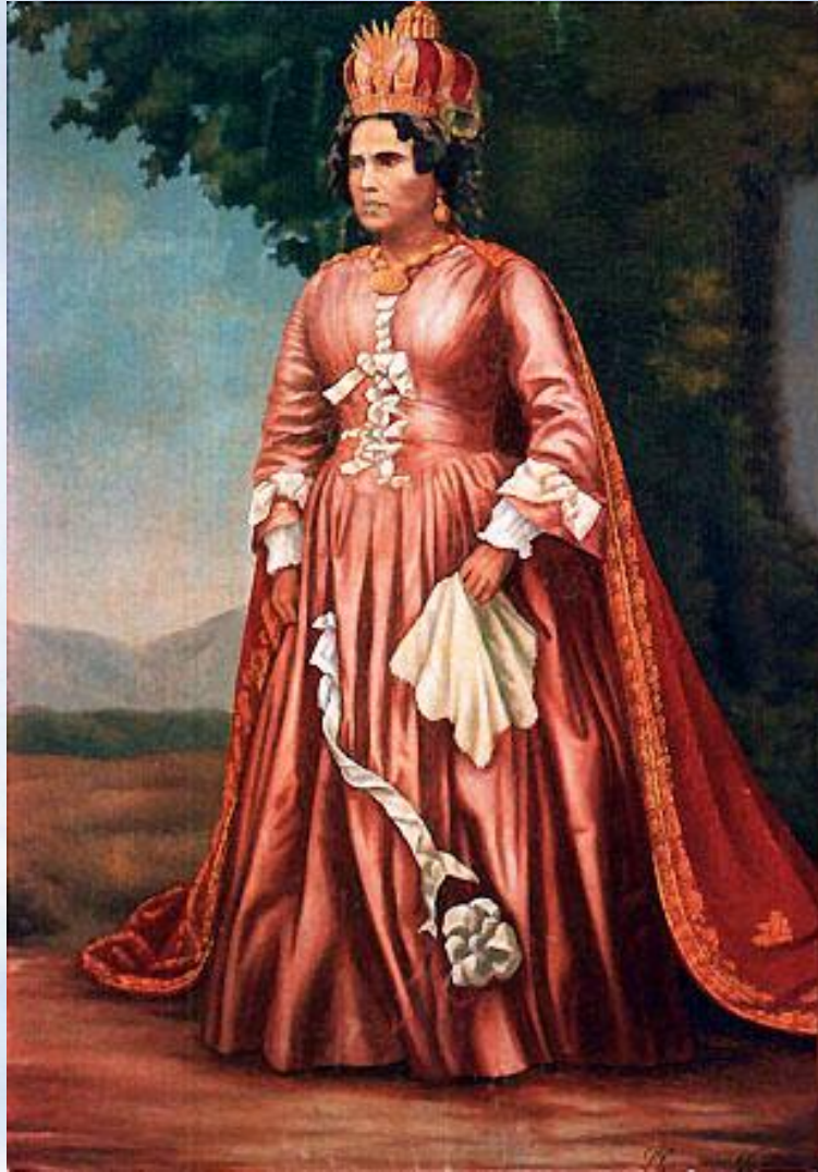
Королева Ранавалуна I

По приказу королевы Ранавалуны I в Антананариву было запрещено строить каменные здания и на протяжении нескольких столетий город состоял из деревянных домов.