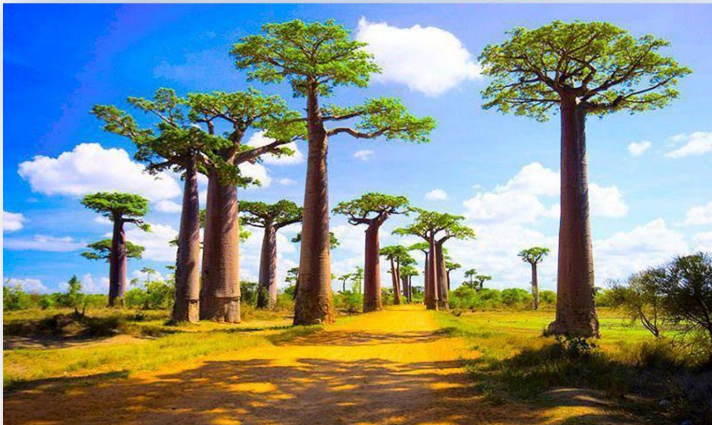
Единственная в мире Аллея Баобабов