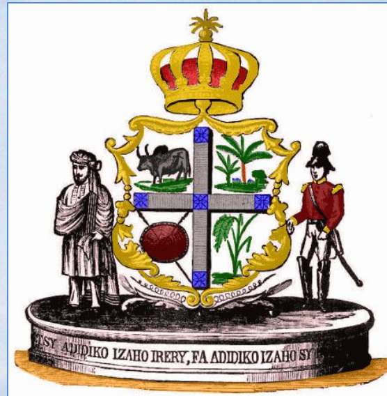
герб королевства Мадагаскар

В XIX веке французские колонизаторы переименовали королевство Имерина в королевство Мадагаскар.