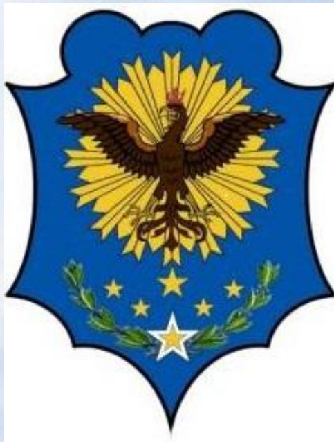
герб королевства Имерина

До XIX века на острове существовало королевство Имерина, которое было завоёвано Францией.