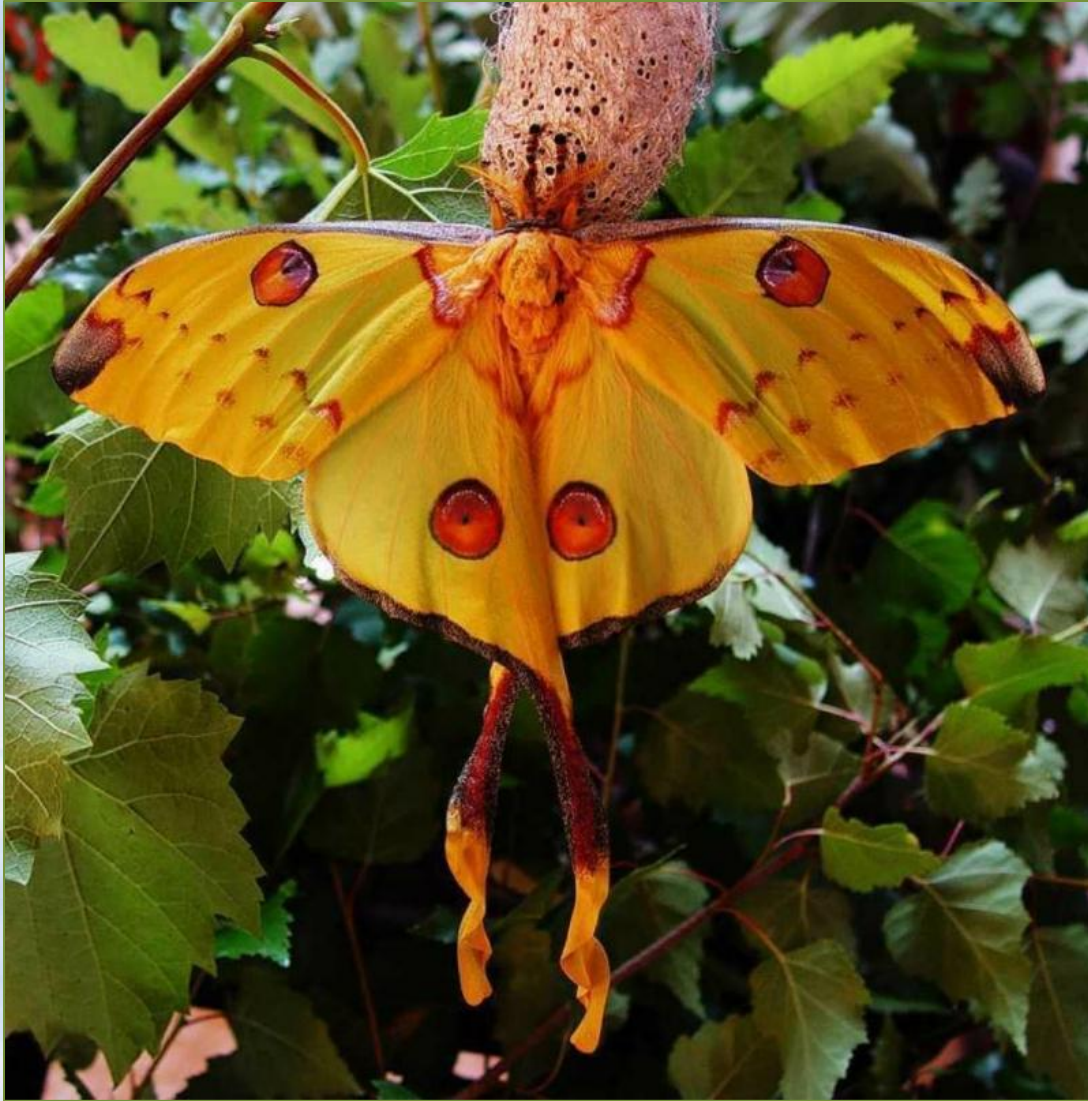
Бабочка Мадагаскарска я комета, или Сатурния