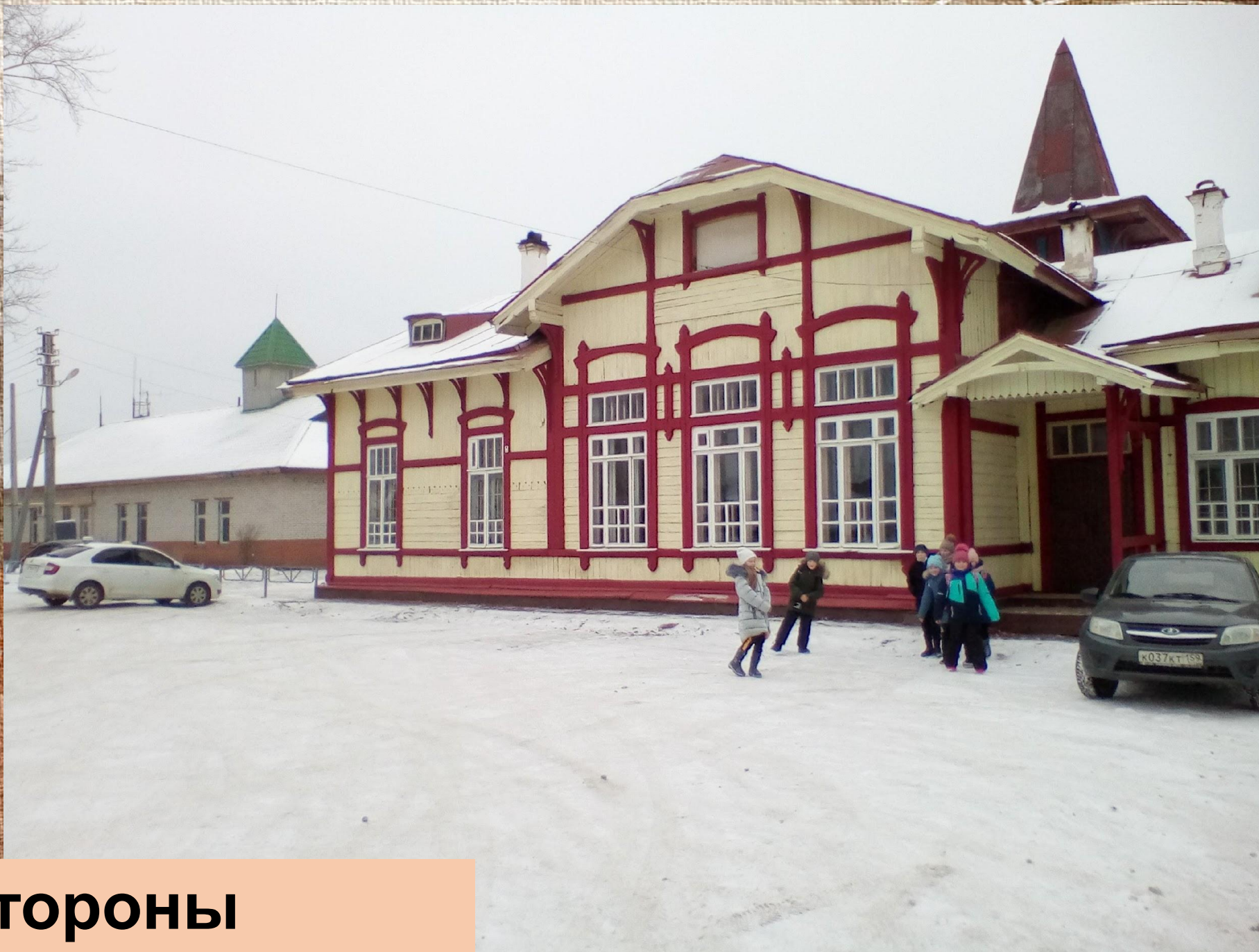
Вокзал со стороны