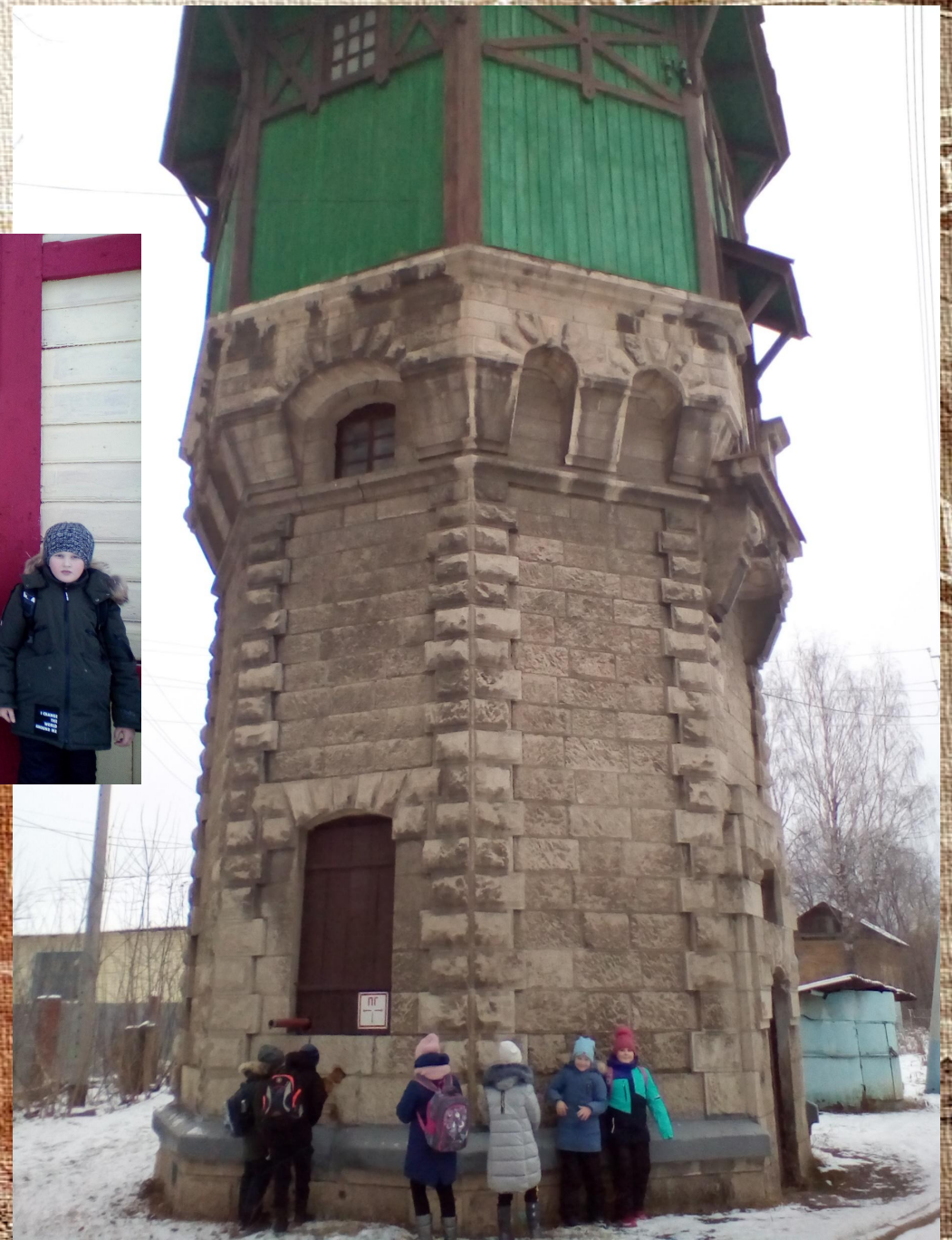
У памятной доски, водонапорной башни и у печки на вокзале.