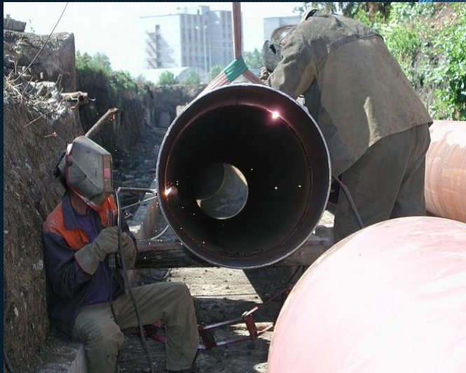
в коммунальном хозяйстве

при сооружении морских и речных судов большого тоннажа, вагонов, котлов высокого давления, мостовых кранов, цистерн, трубопроводов и т.п.