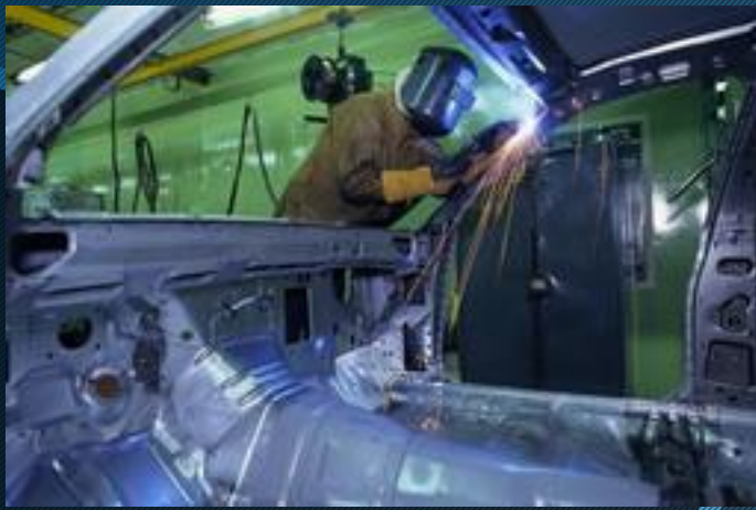
на машиностроительных заводах