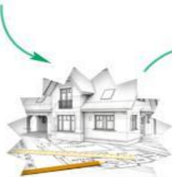
Проектирование или готовый проект