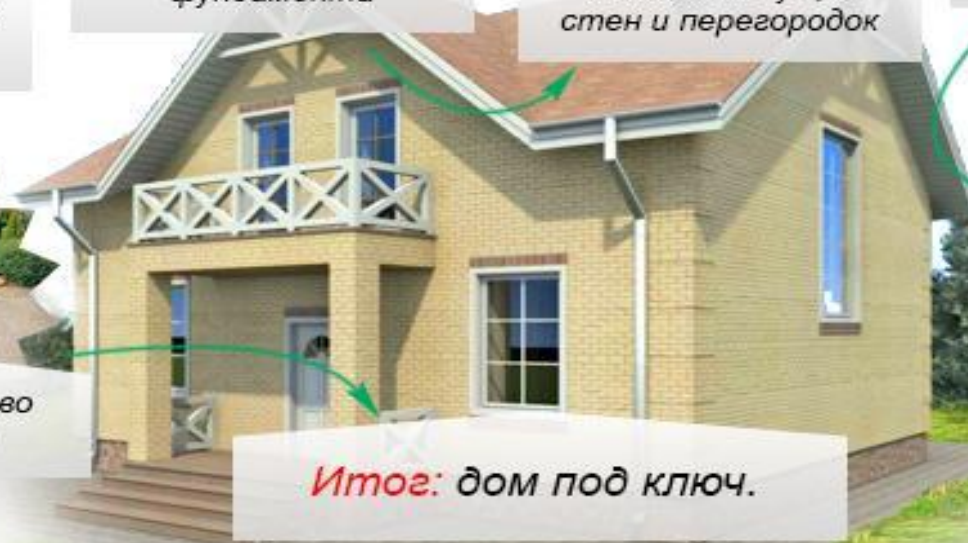
Итог: дом под ключ.