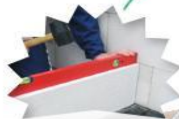
Монтаж несущих стен и перегородок