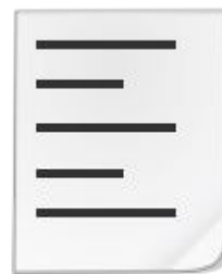
Паспорт рабочей станции