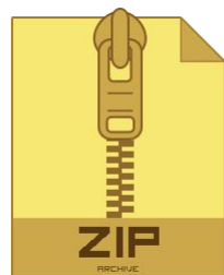
Сведения о работе станции