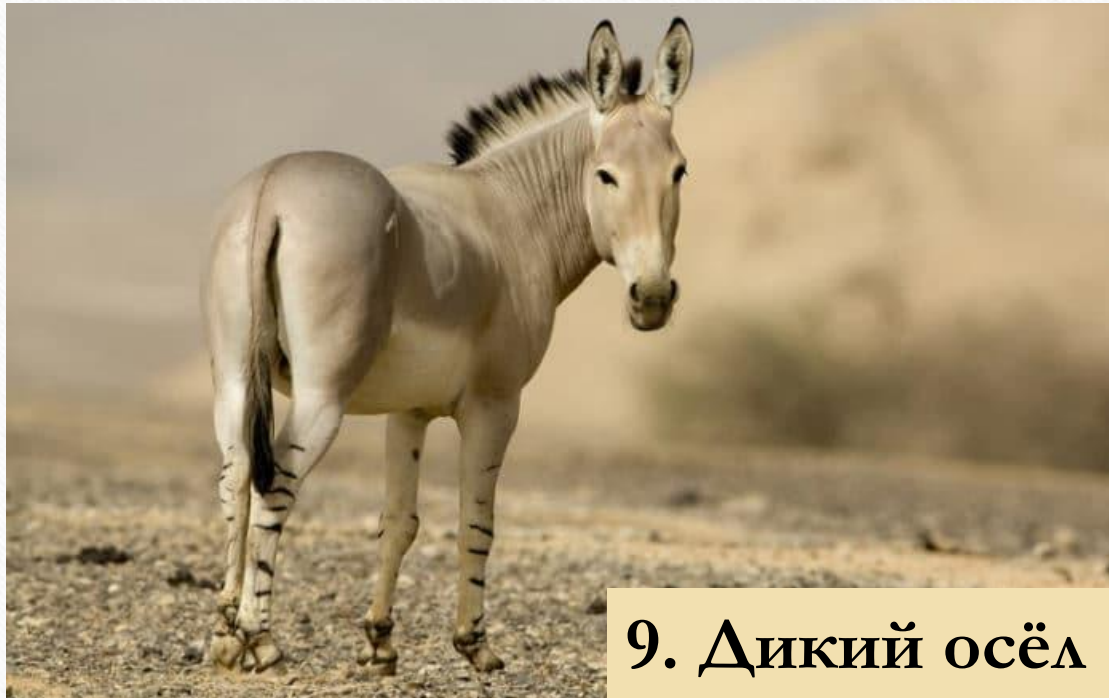
9. Дикий осёл