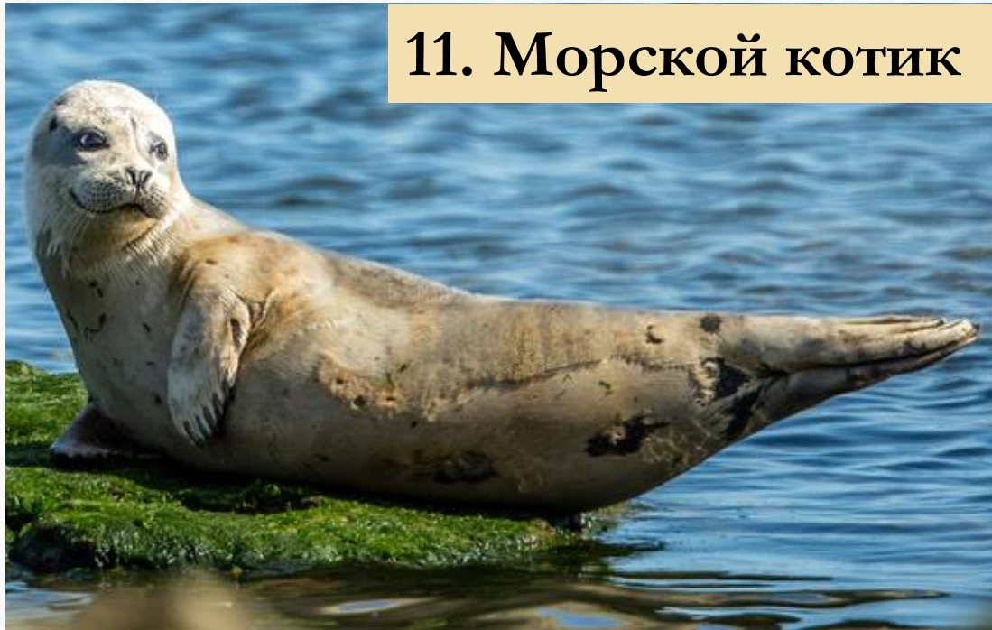
11. Морской котик