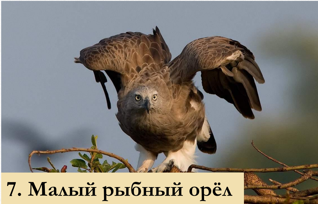
7. Малый рыбный орёл