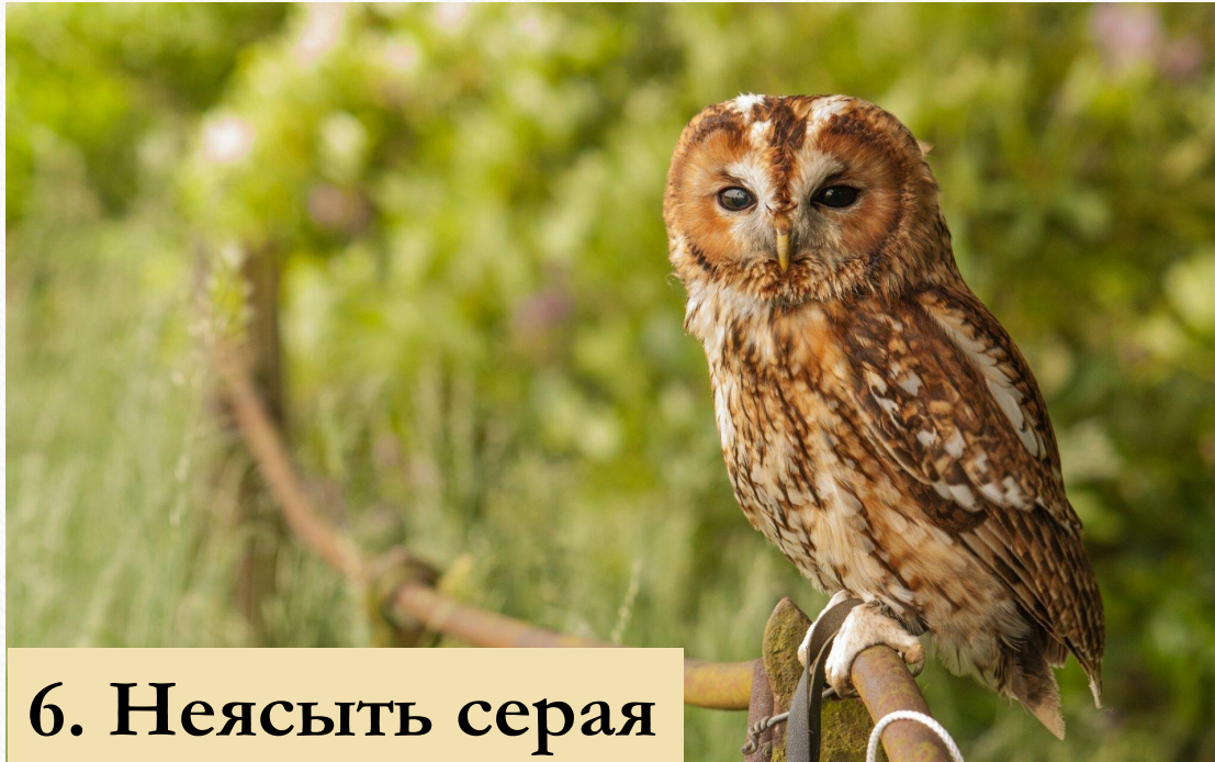
6. Неясыть серая