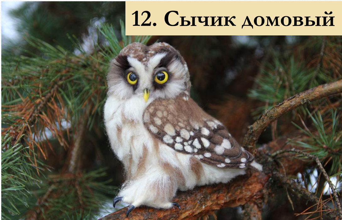
12. Сычик домовый