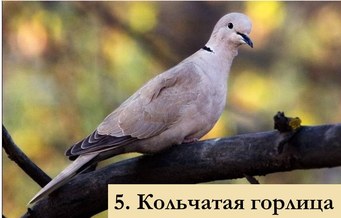
5. Кольчатая горлица