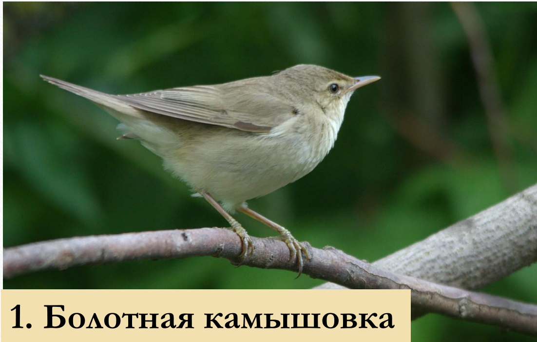
1. Болотная камышовка