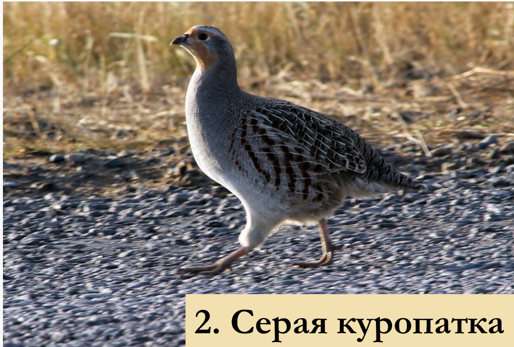
2. Серая куропатка