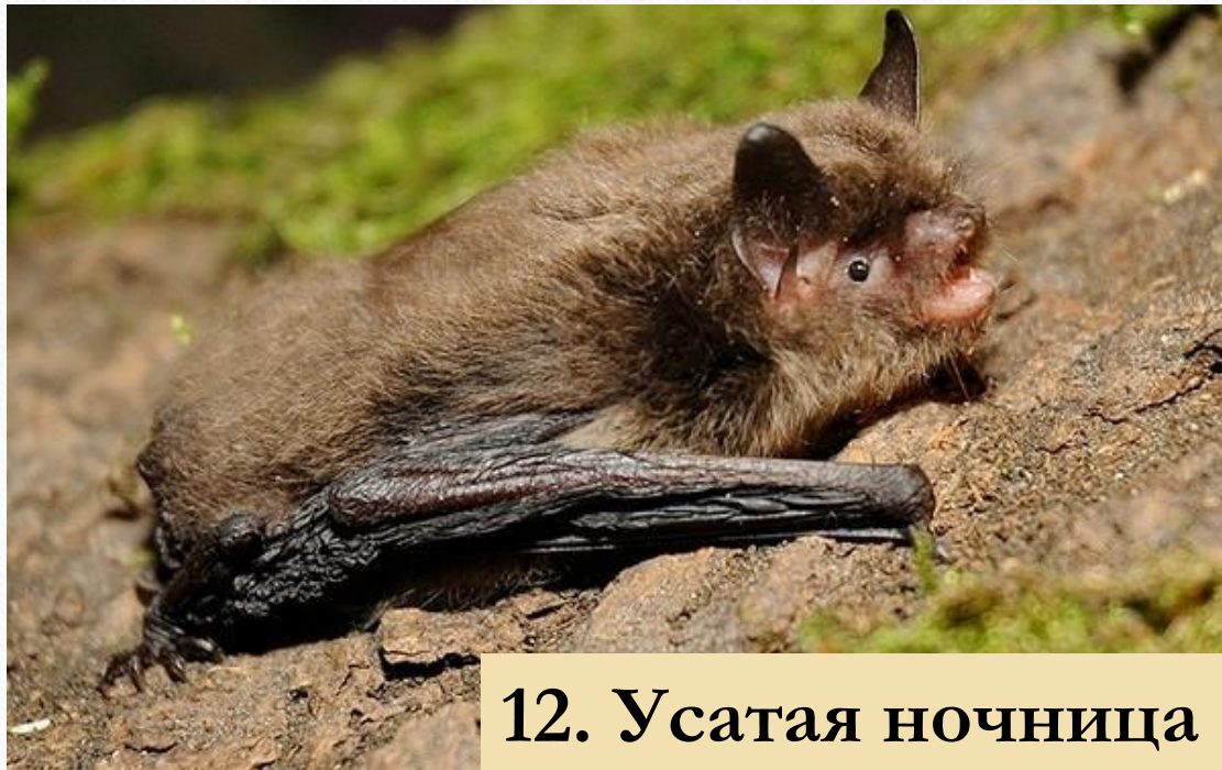
12. Усатая ночница