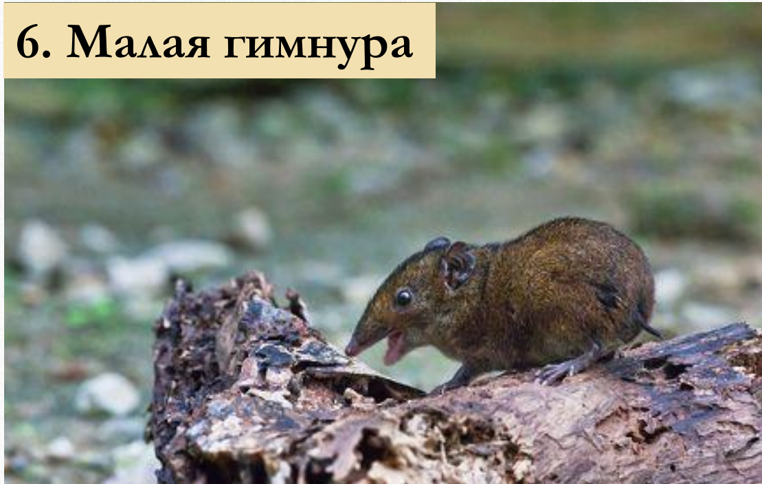
6. Малая гимнура