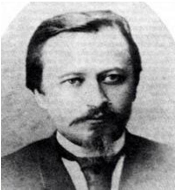
Юлий Бунин, брат писателя (1860 – 1921)