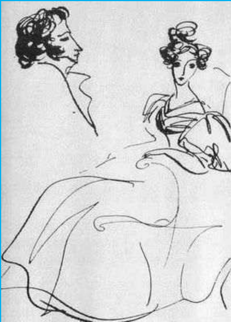
ПУШКИН И АННА КАРЕНИНА

Рисунки Нади Рушевой побывали в космосе. 31 января 1975 года в день рождения юной художницы космонавт Георгий Михайлович Гречко находясь на станции «Салют-4» рассказал о Наде и её судьбе, и показал рисунки которые он специально попросил у её родителей перед полетом. Репортаж транслировался на весь Советский Союз и многие зарубежные страны.