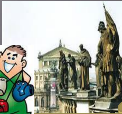
Das Opernhaus in Dresden