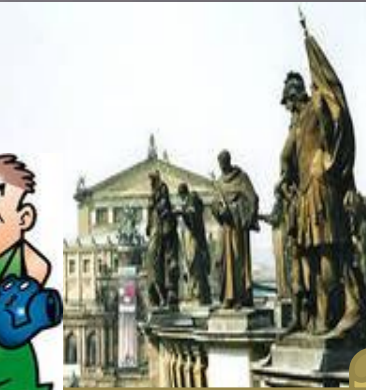
Das Opernhaus in Dresden