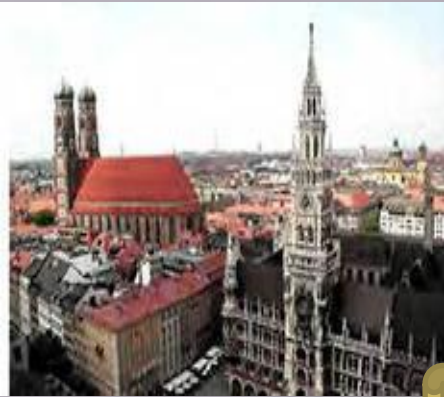
München – die Hauptstadt Bayerns