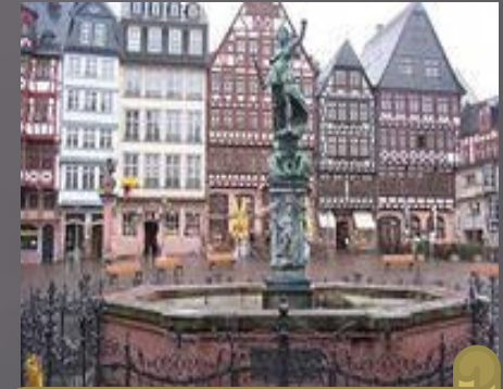
Die Fachwerkhäuser von Frankfurt am Main