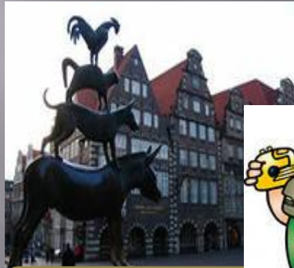
Die Stadtmusikanten von Bremen