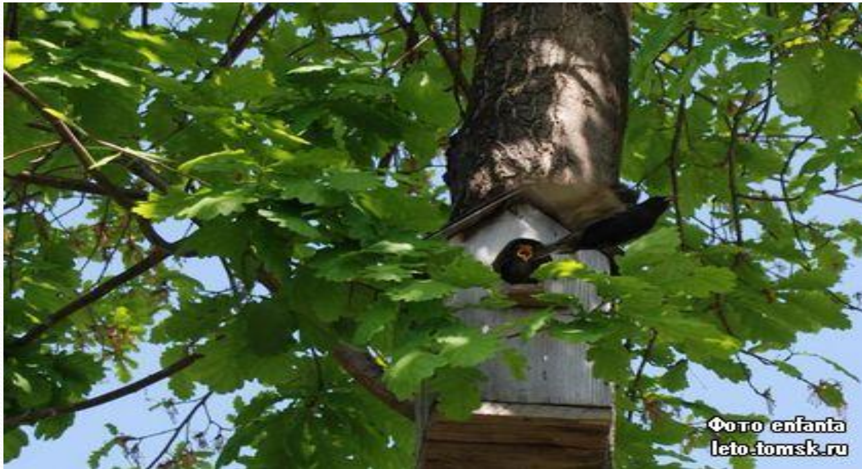
Фото enfants leto-tomsk.ru