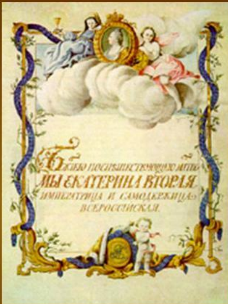
Титульный лист жалованной грамоты Екатерины II