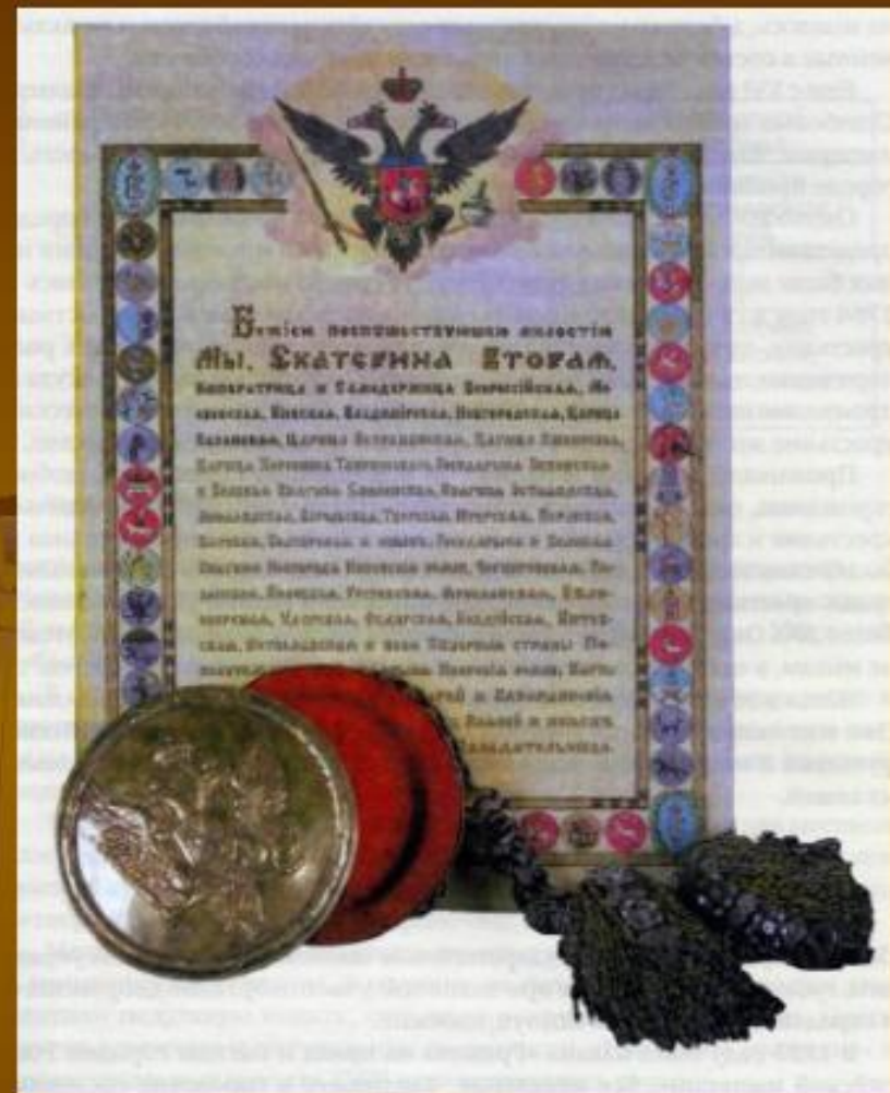
"Жалованная грамота дворянству", подписанная Екатериной II в 1785 году.