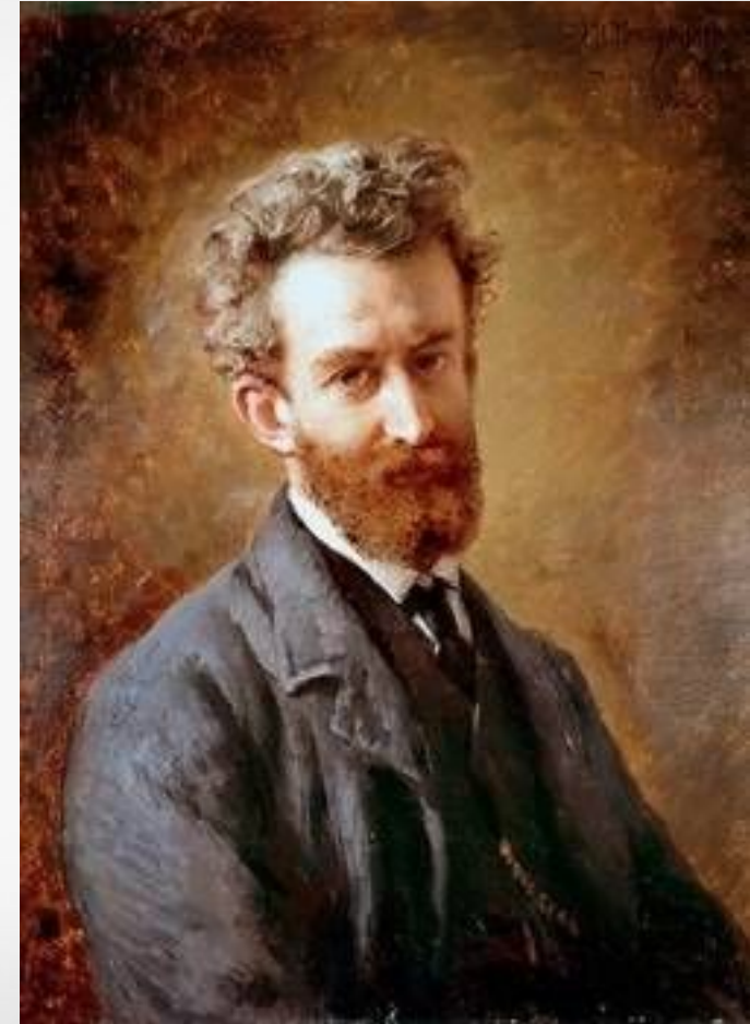
Миклухо-Маклай Николай Николаевич 1846 - 1887

Расовые отличия внешних признаков не влияют на способности людей. Не существует высшей и низшей расы.