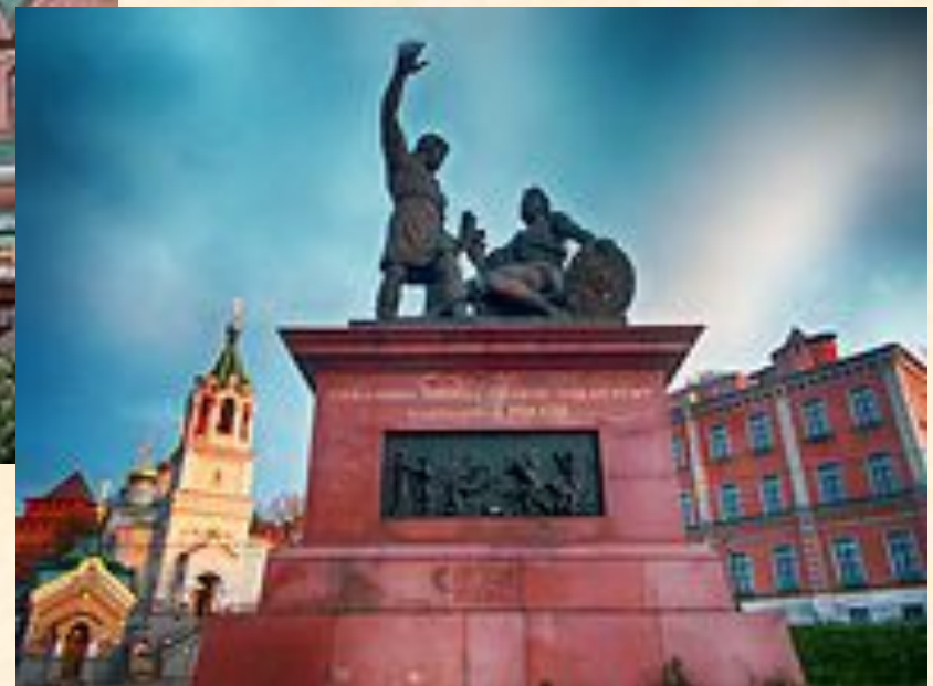
Памятник Минину и Пожарскому в Нижнем Новгороде