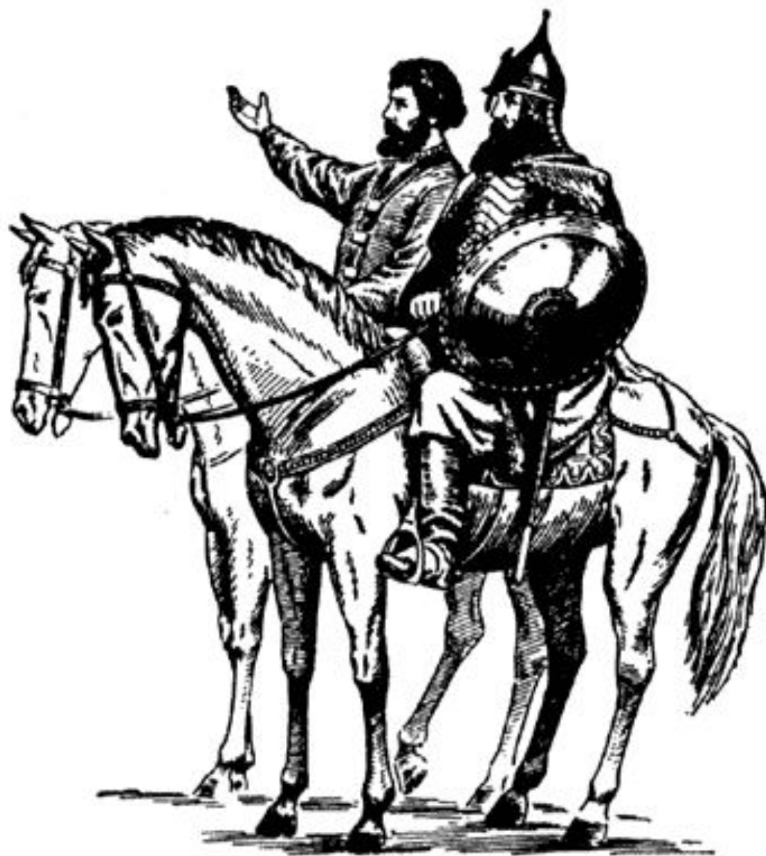
Дмитрий Пожарский и Кузьма Минин