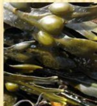
↑ зелёные ← бурые