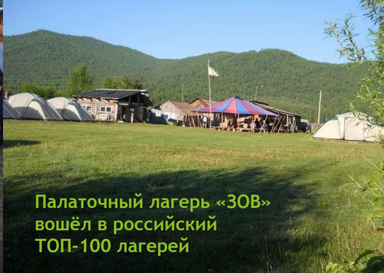
Палаточный лагерь «ЗОВ» вошёл в российский ТОП-100 лагерей