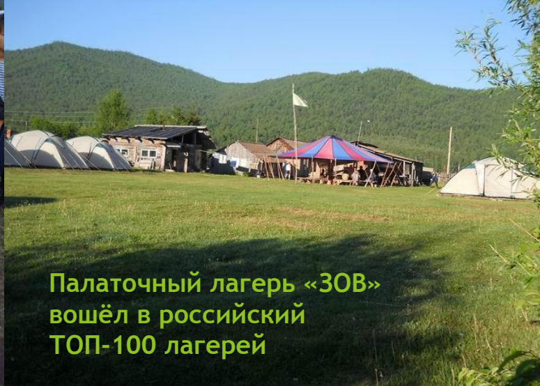
Палаточный лагерь «ЗОВ» вошёл в российский ТОП-100 лагерей