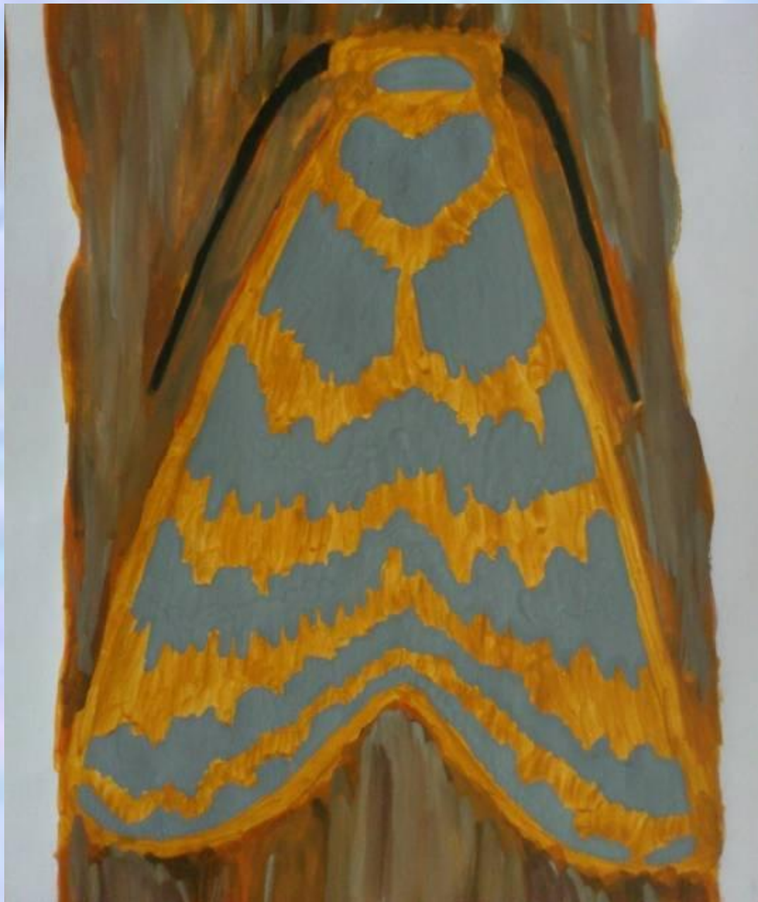
Бабочка – ленточница на