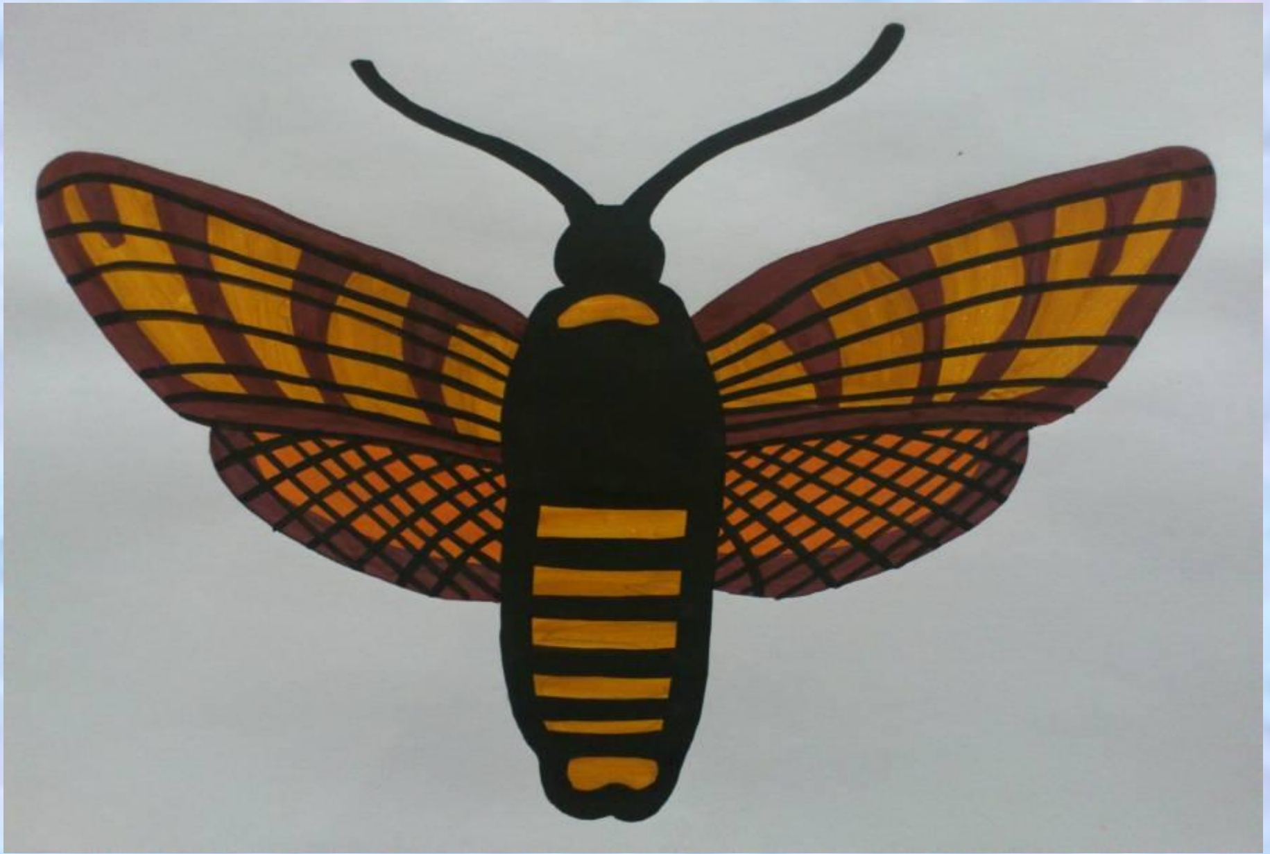
Бражник - языкан