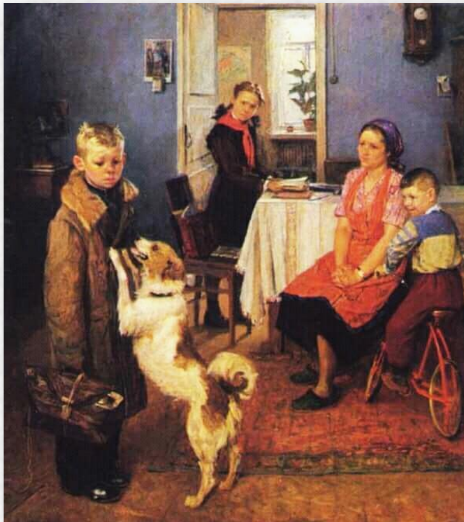
Ф. Решетников «Опять двойка», 1952 год.