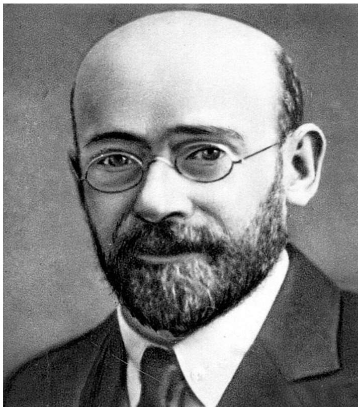
Польский педагог Януш Корчак

«Существует ли жизнь в шутку? Нет, детский возраст — долгие, важные годы в жизни человека... Уважайте текущий час и сегодняшний день! Как ребенок сумеет жить завтра, если мы не даем ему жить сегодня сознательной, ответственной жизнью...»