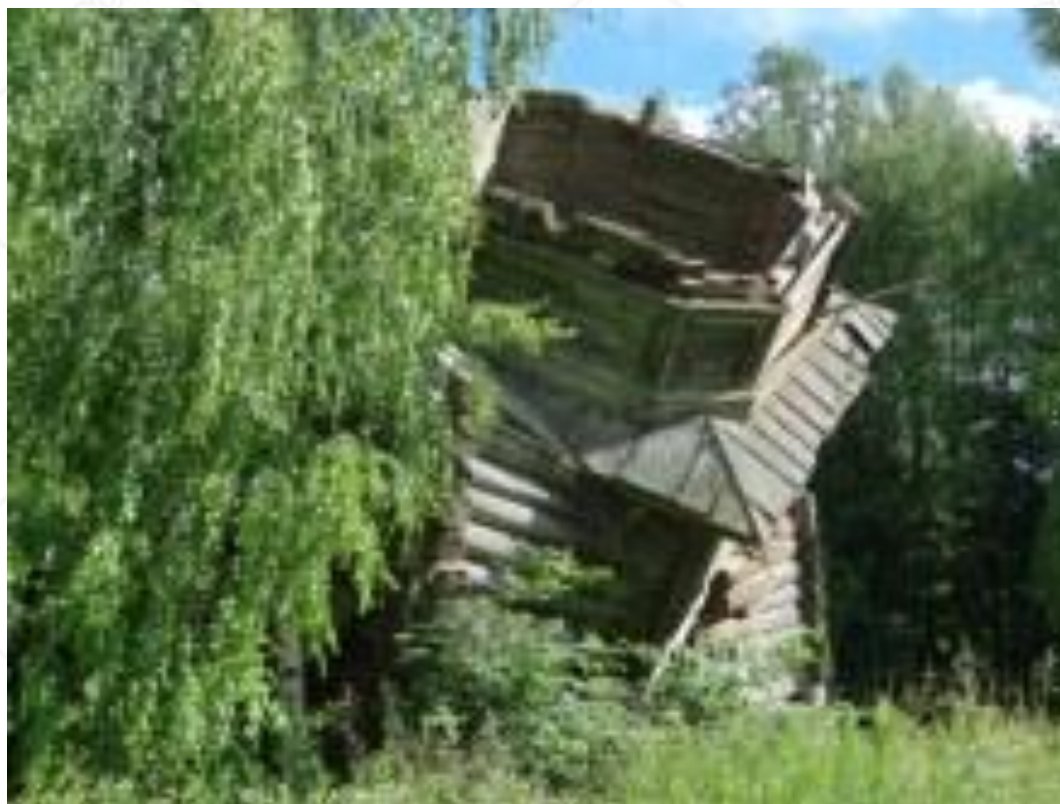
Старая церковь в Круг-Мазарах (до деревни Ошедские 1,3 км)