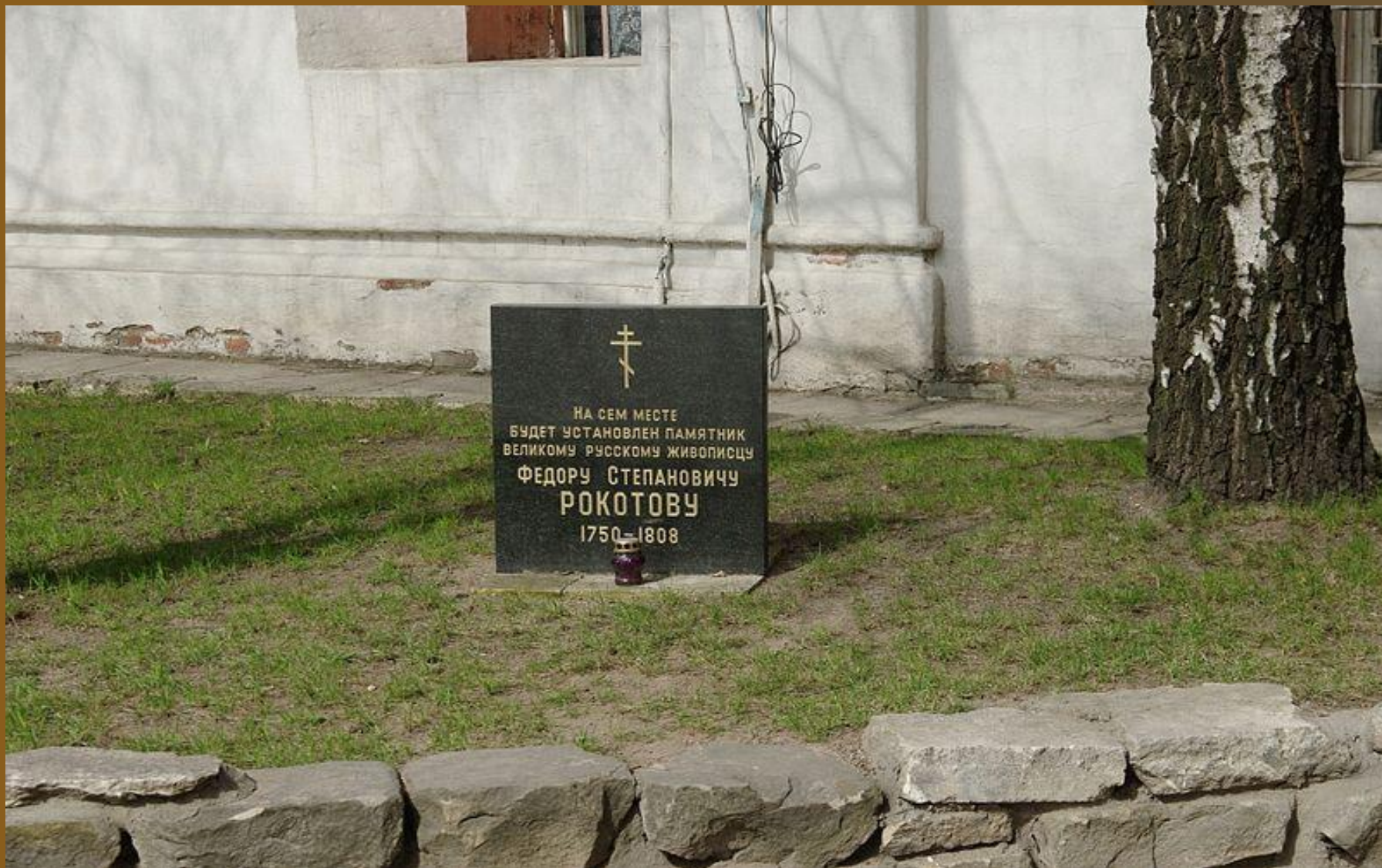
Памятный камень в Новоспасском монастыре