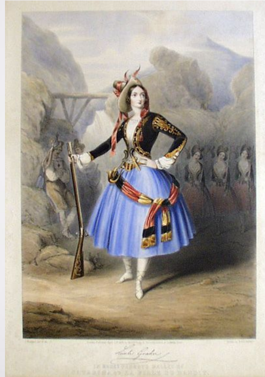
Катарина, дочь разбойника 1846