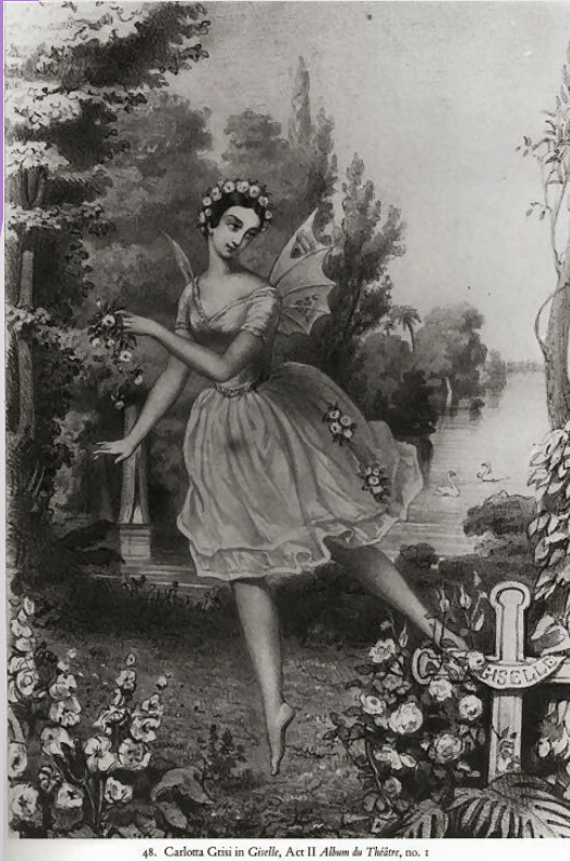
48. Carlotta Grisi in Giselle , Act II Album du Théâtre , no. 1