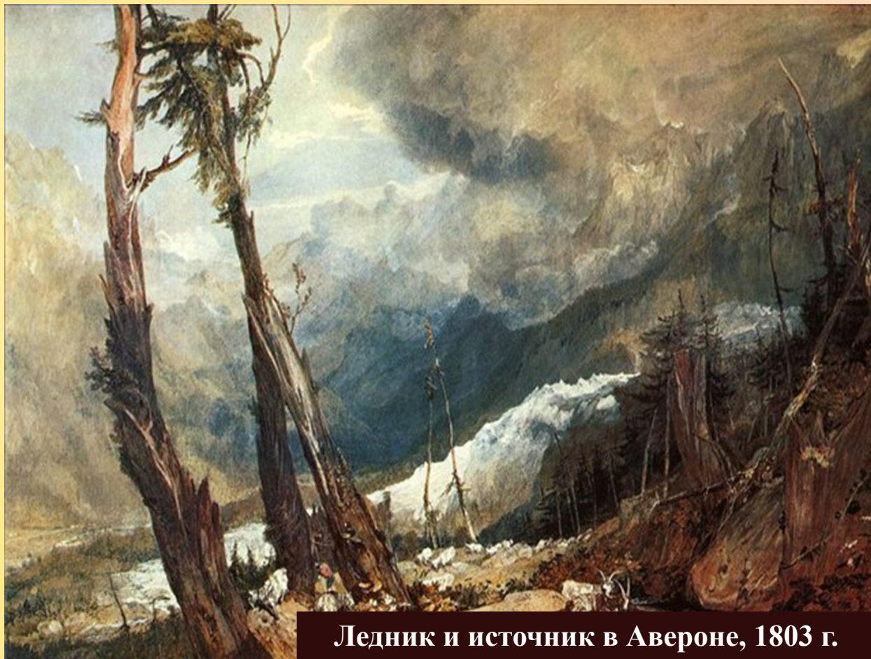
Ледник и источник в Авероне, 1803 г.