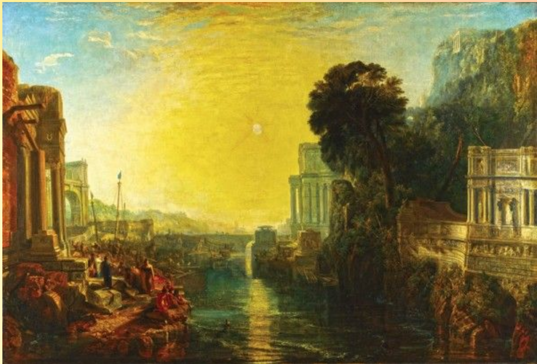
"Основание Карфагена" (1815)