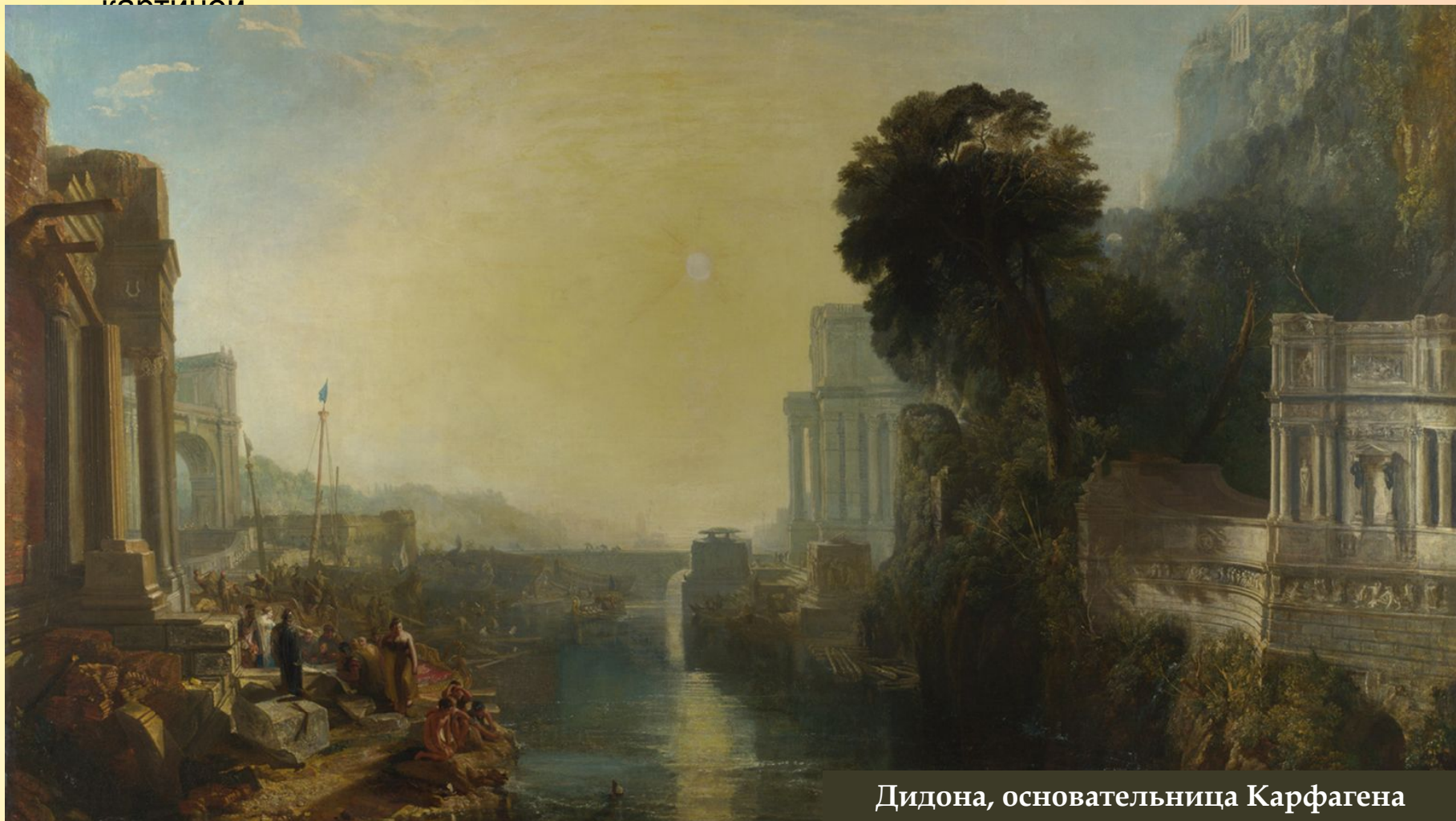
Дидона, основательница Карфагена