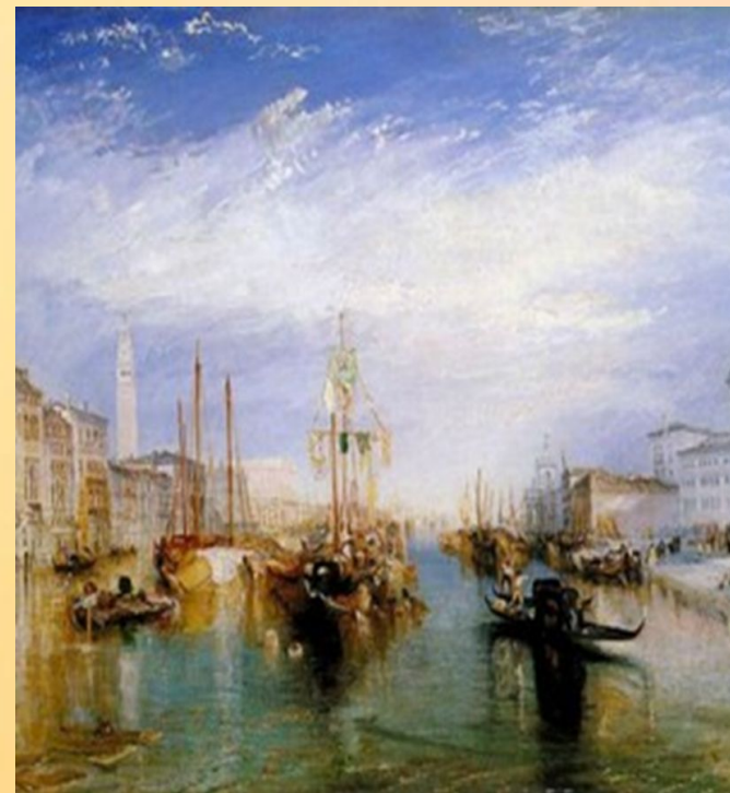
Вид Большого канала в Венеции