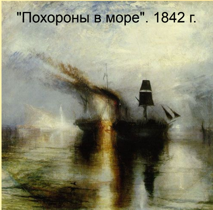
"Похороны в море". 1842 г.