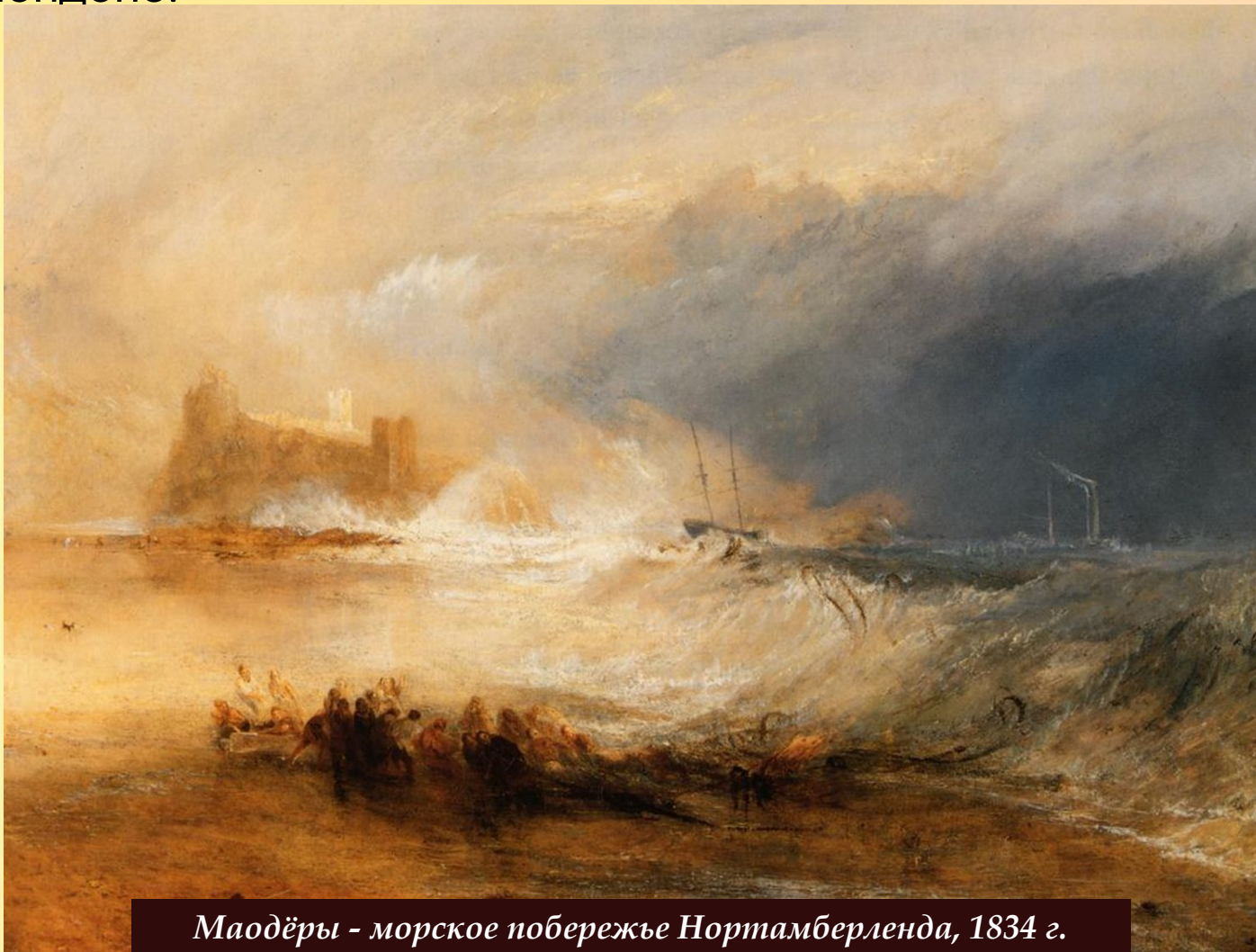
Маодёры - морское побережье Нортамберленда, 1834 г.