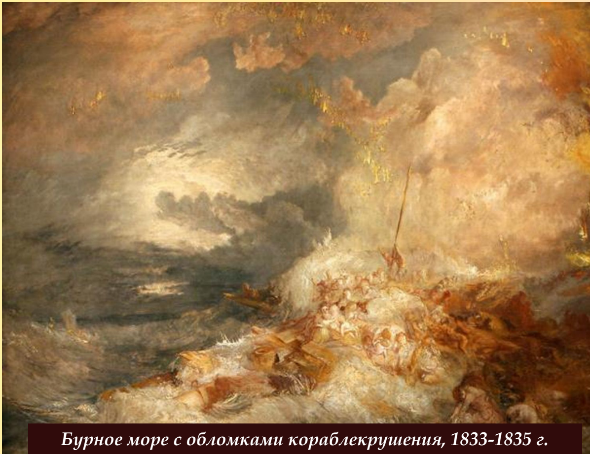
Бурное море с обломками кораблекрушения, 1833-1835 г.