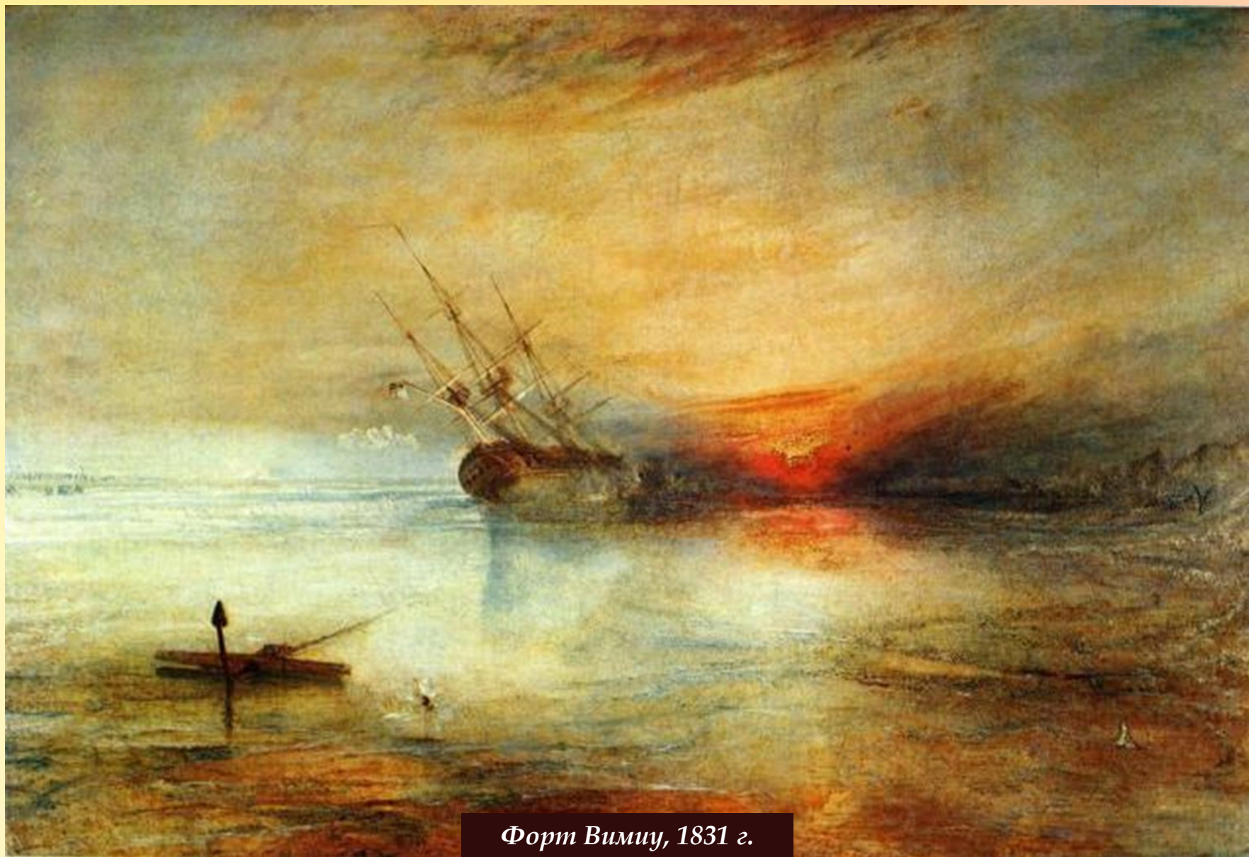
Форт Вимиу, 1831 г.