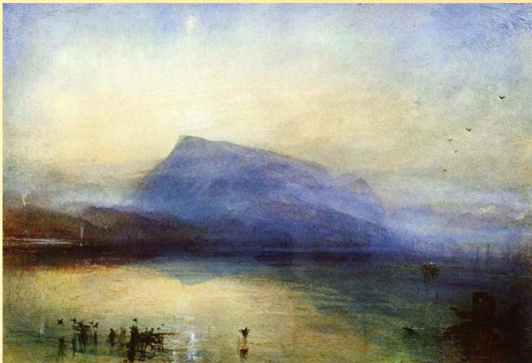
Гора Риги: вид на Люцернское озеро на восходе

Тёрнер постоянно совершенствовал свою технику и к началу XIX века в своих акварелях он достигает силы и выразительности, обычно присущей живописи маслом. Отбрасывая излишнюю детализацию, он создавал новый тип пейзажа, посредством которого художник раскрывал свои воспоминания и переживания. В свои картины Тёрнер вводил изображения людей в сценах прогулок, пикников, полевых работ. Внимательно и с любовью изображая человека, художник подчёркивал несовершенство его природы, его восторг и бессилие перед огромным окружающим миром.