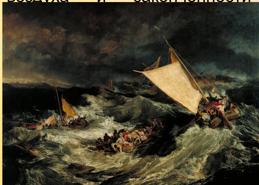
Кораблекрушение, 1805 г.