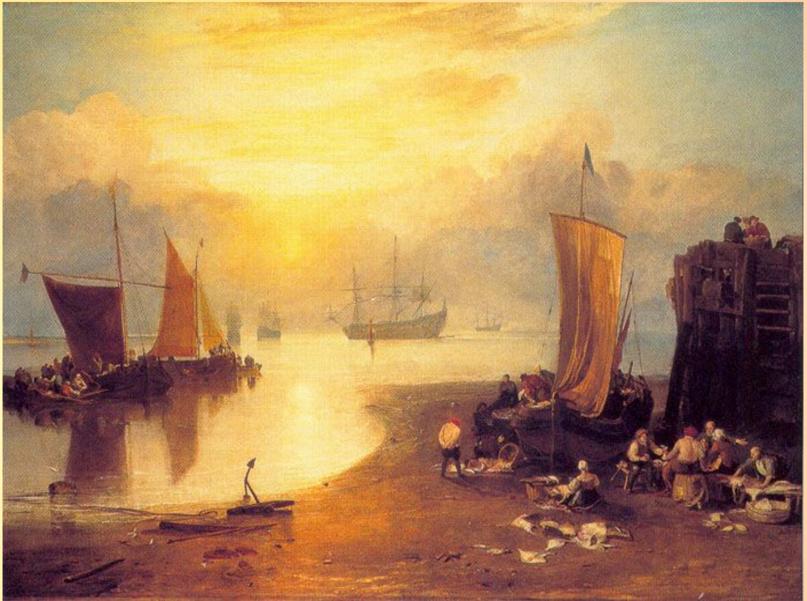
"Восход солнца в тумане" (1807)