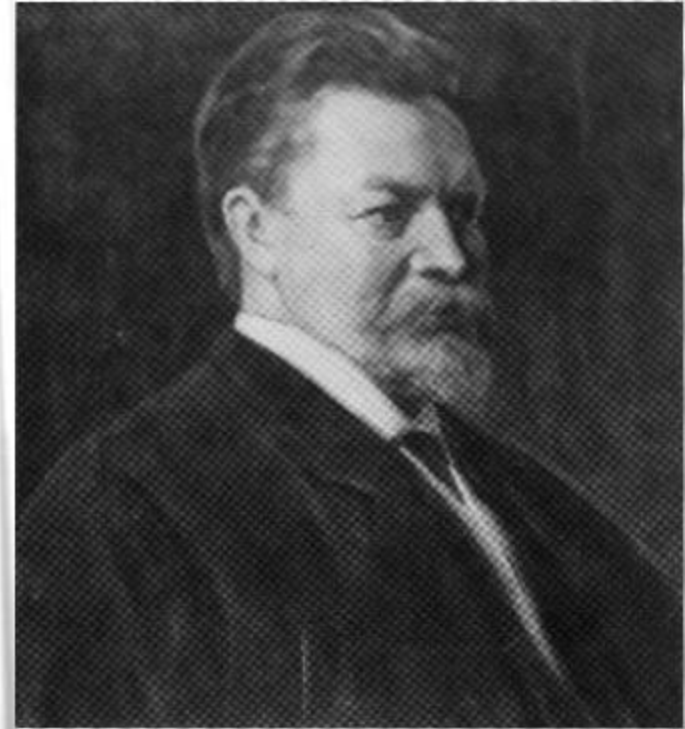
Рудольф Челлен, шведский политолог

Геополитическое положение – оценка места страны на политической карте, ее отношение к различным государствам.