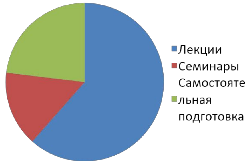
Распределение учебного времени

Цель ОГП: разъяснение студентам государственной политики в области обеспечения военной безопасности страны, вопросов отечественной истории, традиций армии и флота, проблем государственного и военного строительства, военной педагогики и психологии, законодательства РФ, норм международного гуманитарного права, практики обучения и воспитания личного состава, а также формирования убеждения в необходимости вооружённой защиты Отечества.