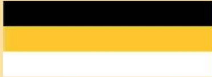
Указом Александра II от 11 июня 1858 года был введён чёрно-жёлто- белый флаг