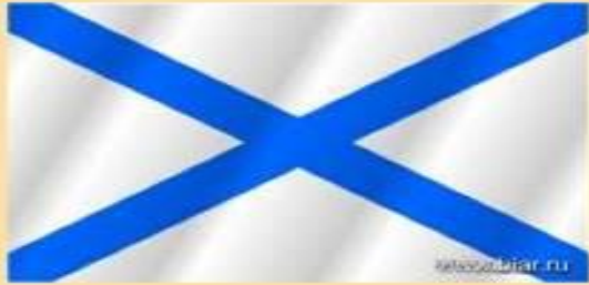
Военно - морской флаг (Андреевский флаг)