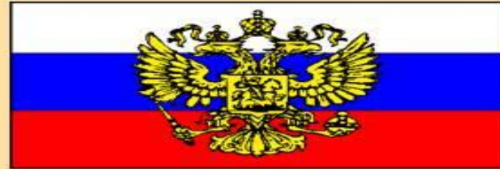
Флаг Российской Федерации